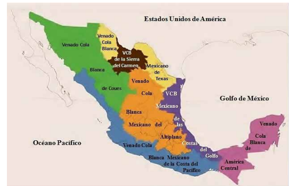
Figura 2. Mapa de las categorías de clasificación de trofeos de caza, de las subespecies de venado cola blanca en México, para el Safari Club Internacional.

Además, el SCI Capitulo Monterrey instituyó el Premio Hubert Thummler, en dos niveles. El primero denominado Nivel Oro, donde el cazador deberá coleccionar cinco categorías de venado cola blanca (sin ningún orden específico), una categoría de venado bura ( Odocoileus hemionus ) y una categoría de venado temazate ( Mazama spp.); que representan siete de once categorías reconocidas por el Libro de Records para México (SCI, 2014a). El participante que logre completar las especies antes mencionadas, recibirá un trofeo de bronce sobre una base de madera con una placa conmemorativa. El segundo nivel denominado Nivel Diamante, el cazador deberá coleccionar las siete categorías de venados cola blanca mexicanos reconocidas por SCI, dos categorías de venado bura