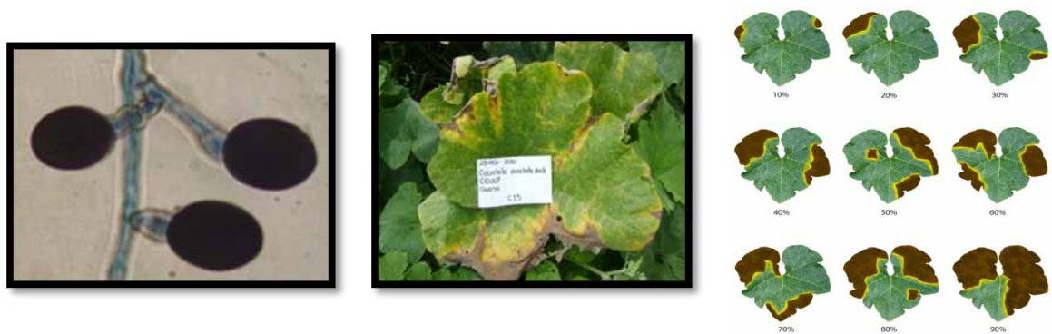
Figura 5. Nigrospora sp. Estructura aislada (a), presencia en lámina foliar (b), y nivel de daño a medida que el patógeno progresa (c).