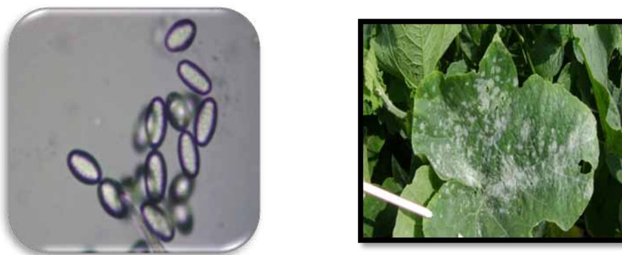
Figura 6. Oidium sp. Estructura aislada (a), presencia en lámina foliar (b), y nivel de daño a medida que el patógeno progresa (c).