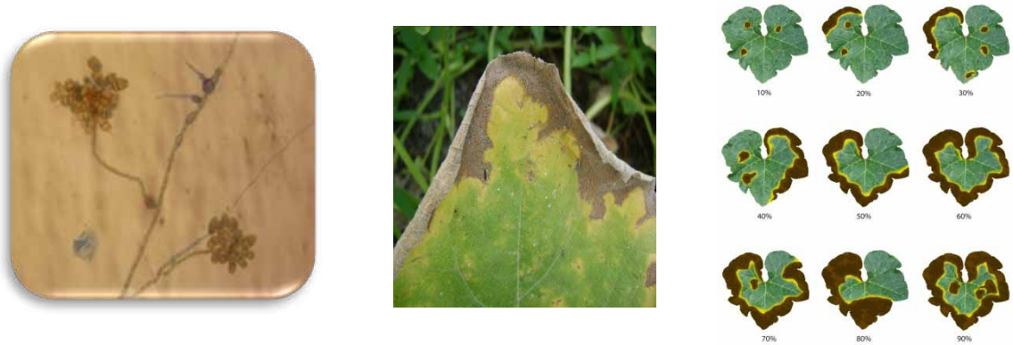
Figura 2. Curvularia sp. Estructura aislada (a), presencia en lámina foliar (b) y nivel de daño a medida que el patógeno progresa (c).