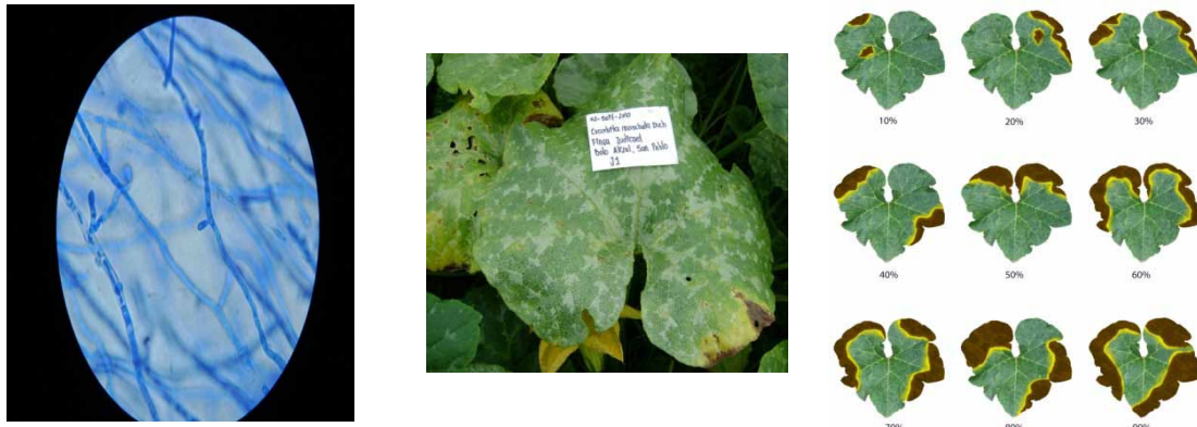
Figura 4. Micelio sterilia sp. Estructura aislada (a), presencia en lámina foliar (b), y nivel de daño a medida que el patógeno progresa (c).