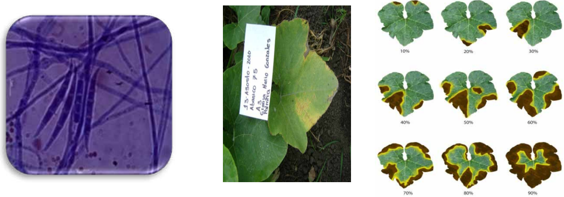
Figura 3. Fusarium sp. Estructura aislada (a), presencia en lámina foliar (b), y nivel de daño a medida que el patógeno progresa (c).

Si bien la agresividad de Fusarium es evidente, se ha controlado con fungicidas convencionales con éxito relativamente modesto. Sin embargo, LIN et al. (2011) y CAO et al. (2011) reportaron opción de control de Fusarium en pepino por medio competencia en inoculación con Mycorrhiza arbuscular , el primero, y por una cepa específica de Bacillus subtilis , el segundo. Este hongo ha sido reportado como patógeno común en diferentes Cucurbitas en India (AVINASH y RAVISHANKAR, 2013).