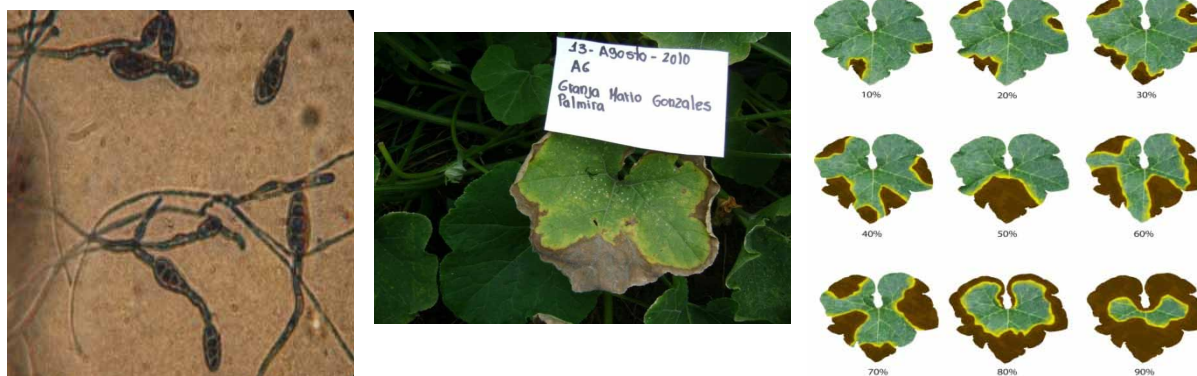
Figura 1. Alternaria sp. Estructura aislada (a), presencia en lámina foliar (b), y nivel de daño a medida que el patógeno progresa (c).

En el cultivo artificial, las colonias formadas por este patógeno presentaron colores que iban desde el púrpura al rosado y blanco a amarillo (Fig., 3), con micelio blanco algodonoso. Microscópicamente el micelio y las conidias fueron hialinas, evidenciando producción de macroconidios largos, en forma de media luna, multiseptados, que son llevados típicamente por esporodocios, y microconidios muy pequeños, esféricos, ovales, alargados o en forma de media luna sobre hifas simples, ramificadas o no; por lo común, también se producen clamidosporas en el micelio.