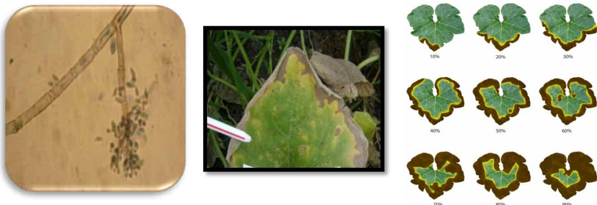
Figura 7. Penicillium sp. Estructura aislada (a), presencia en lámina foliar (b), y nivel de daño a medida que el patógeno progresa (c).

La influencia de factores climáticos determinó que la GMGA presentara menos severidad en el ataque de los patógenos identificados.