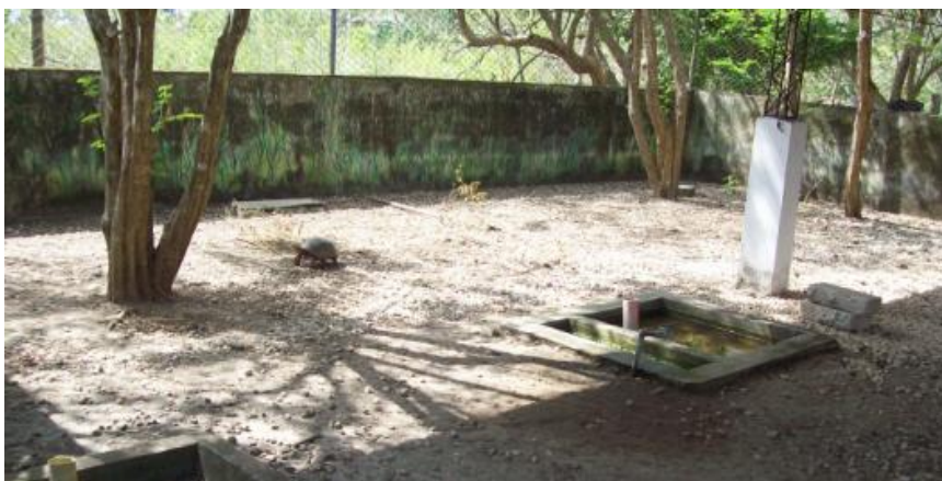
Figura 1. Área de experimentación en la granja El Perico, Universidad de Sucre

Se definieron conductas (estados) que se agruparon en categorías (pautas y eventos) comportamentales y se relacionaron con aspectos reproductivos dentro de una conducta adaptando la metodología de MIKICH (1991), a partir de las mediciones se elaboraron diagramas para facilitar la interpretación del cubrimiento de las categorías y conductas detectadas, trazando en una gráfica una línea interpretativa que permitiera diferenciar conductas particulares o específicas de tipo individual que por su naturaleza diferenciable se hicieran conspicuas (PORTO y PIRATELLI, 2005).