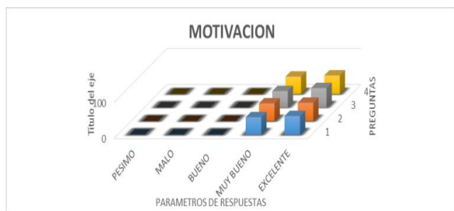
Figura 5. Comportamiento del indicador motivación

En el aspecto de evaluación en la tabla 8 y la figura 6 se ve el comportamiento de cada uno de los indicadores. En la pregunta, ¿considera usted que los parámetros de evaluación, Examen (30puntos), Actuación (40 puntos), investigación (30 puntos), son los más óptimos?, contestaron con un 52, 2% que es excelente. Considera usted que los Docentes aplican la calificación de acuerdo a los parámetros establecidos en la UTM, Examen (30puntos), Actuación (40 puntos), investigación (30 puntos), a esta pregunta contestaron que 63,3 que es excelente.