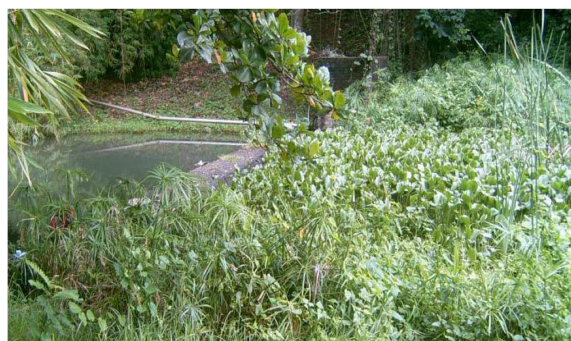
Figura 1. Localidad de muestreo Chalons 1.

El presente estudio se realizó desde marzo de 2005 hasta marzo de 2006, en dos localidades del aliviadero de la represa Chalons, construida entre 1904 y 1906, al norte de la ciudad de Santiago de Cuba, en el km 6 1/2 de la Carretera Central (Figs. 1 y 2).