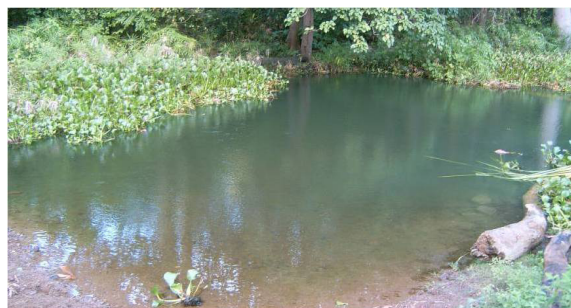
Figura 2. Localidad de muestreo Chalons 2.

Caracterización de las áreas de estudio: La primera localidad fue nombrada Chalons 1, ubicada en los 75° 48' 49"W y 20° 4' 12"N de coordenadas a 82 m snm, está a 50 m de la cortina de agua, junto al primer muro del aliviadero. En un área de 15 por 10 m 2 . La vegetación acuática está formada principalmente por E. crassipes , que ocupa el 90% del área. También aparecen las especies Typha dominguensis , Salvinia hispida y en las orillas Cyperus rotundus . El fondo es fangoso con abundante detritus y profundidad máxima de 0,8 m. Presenta pocos árboles y arbustos a su alrededor, permitiendo la incidencia los rayos solares directamente sobre el área a determinada hora del día.