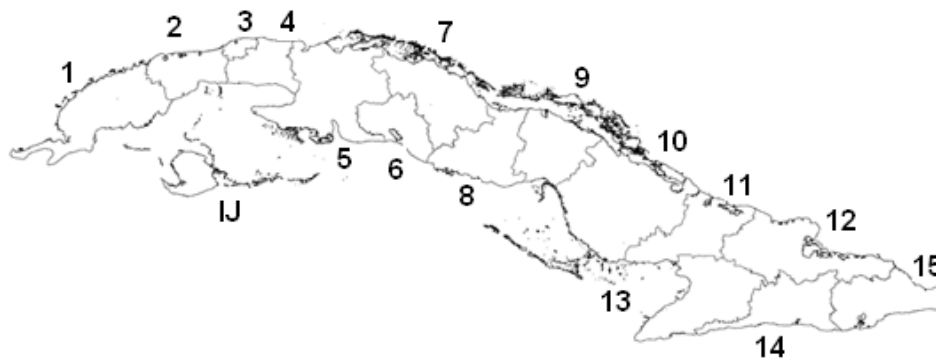
Figura 1. División político-administrativa actual. Provincias: 1, Pinar del Río; 2, Artemisa; 3, La Habana; 4, Mayabeque; 5, Matanzas; 6, Cienfuegos; 7, Villa Clara; 8, Sancti Spíritus; 9, Ciego de Ávila; 10, Camagüey; 11, Las Tunas; 12, Holguín; 13, Granma; 14, Santiago de Cuba; 15, Guantánamo; IJ, municipio especial Isla de la Juventud.

En la lista que se ofrece a continuación se relaciona primero la provincia en mayúsculas sostenidas y el municipio con mayúscula inicial, después la localidad lo más precisa posible, el número actual de la Colección de la Academia de Ciencias (CZACC), que se inicia con el número 4 que identifica a los reptiles, después un punto y la numeración que le corresponde a cada ejemplar; a continuación, la fecha y el o los recolectores; el número que poseía el ejemplar en colecciones anteriores donde se encontraba depositado: AC (Academia de Ciencias), IB (Instituto de Biología), IZ (Instituto de Zoología), todas en La Habana; por último, el estado de conservación, que se escribe como B (bueno), con alguna anotación si la necesitara, o M (malo). Los nombres de localidad, provincia y municipio se refieren según la división político-administrativa actual (GACETA OFICIAL DE LA REPÚBLICA DE CUBA, 2010) (Fig. 1).