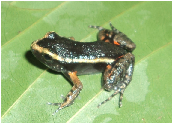
Figura 4. Leptodactylus lineatus registrado em área de pastagem, na região de Porto Velho, Rondônia - Brasil.

As demais espécies Leptodactylus lineatus (Fig.4), Allobates sp., Scinax ruber , Leptodactylus andreae , Leptodactylus chaquensis , Leptodactylus hylaedactylus , Leptodactylus rhodomystax , Leptodactylus wagneri e Pristimantis sp., foram encontradas em ambos os locais amostrais.