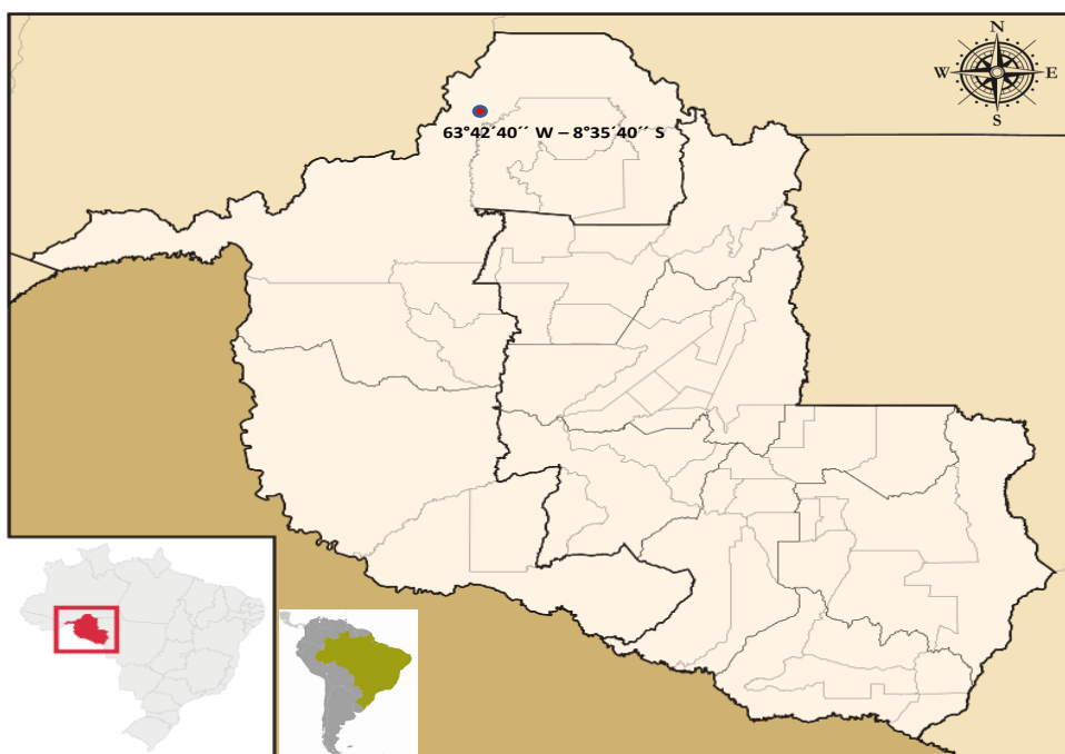
Figura 1. Área de estudo com localização do ponto de coleta.

Os indivíduos encontrados casualmente na área do estudo também foram inseridos no número total de espécimes coletados. Os exemplares coletados foram triados, e dois indivíduos de cada espécie foram selecionados para identificação taxonômica. Posteriormente, foram submetidos à eutanásia por imersão em água com gelo. Em seguida, os indivíduos foram fixados em formol a 10%, etiquetados e armazenados em recipientes com tampa, para posterior identificação em laboratório. Na identificação dos espécimes foram utilizados como auxílio às chaves taxonômicas propostas por DE LA RIVA et al. (2000), LIMA et al. (2008), e FROST (2015). Todos os trabalhos de coletas em campo e transporte dos espécimes foram