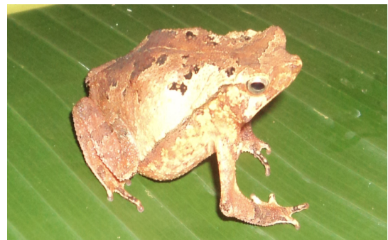
Figura 3. Rhinella gr. margaritifera registrado em área de floresta secundária, na região de Porto Velho, Rondônia - Brasil.

Algumas espécies foram encontradas exclusivamente em ambientes de áreas de pastagens ( Rhinella marina , Rhinella major , Rhinella granulosa , Dendropsophus sp. , Hypsiboas raniceps e Elachistocleis sp. ) enquanto outras apenas em área de floresta secundária, como a Rhinella gr. margaritifera (Fig.3), Allobates gr. marchesianus , Scinax garbei , Scinax nebulosus , Chiasmocleis sp. e Pristimantis fenestratus .