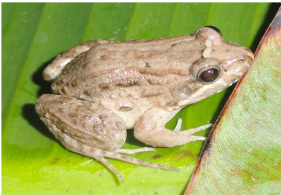
Figura 2. Leptodactylus chaquensis registrado em área de pastagem, na região de Porto Velho, Rondônia - Brasil.

As espécies mais abundantes foram a Leptodactylus chaquensis (Fig.2) e Leptodactylus andreae , com 12 e 8 indivíduos, respectivamente, enquanto que as espécies Allobates gr. marchesianus , Rhinella granulosa , Rhinella gr. margaritifera , Dendropsophus sp. , Chiasmocleis sp. , Elachistocleis sp. e Pristimantis fenestratus , apresentaram apenas um indivíduo por espécie.