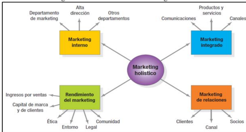
Figura 3 Dimensiones del marketing holístico