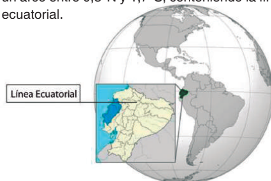
Figura 2. Ubicación geográfica del área de estudio; la zona continental de la provincia de Manabí (azul).

El área de estudio se emplaza en el litoral continental de la provincia de Manabí, costa central del Ecuador (figura 2), que comprende un arco entre 0,3°N y 1,7°S, conteniendo la línea ecuatorial.