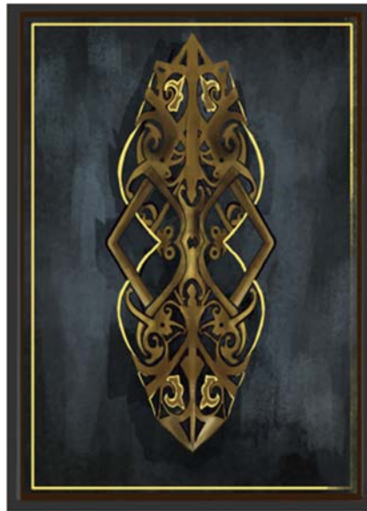
Gambar 2. Desain Backcard