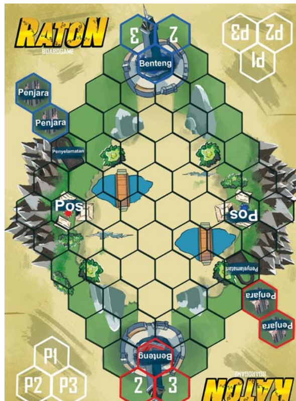
Gambar 3. Desain Papan Permainan