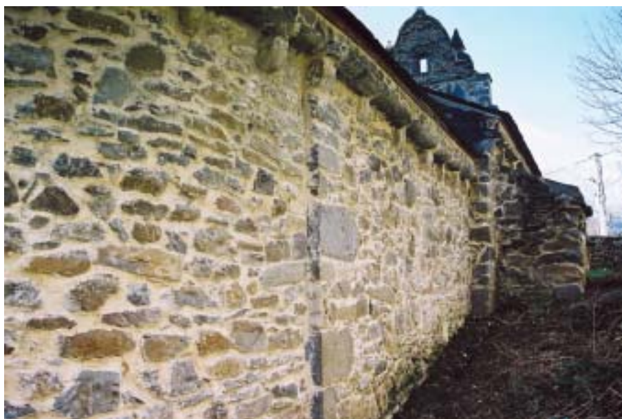
Fig. 5. Santa María de Monasteriu d'Ermu, siglo XIII. Paramento de mampostería de caliza enripiada con presencia de elementos de mayor envergadura y retocados en la zona de unión de la nave con el ábside, pero sin que podamos considerarlos trabajos realizados por un maestro cantero propiamente dicho

Esta homogeneidad que presenta el Alto Narcea contrasta con la ejecución en sillería del cercano monasterio de San Miguel de Bárzana (fig. 8), en el municipio de Tinéu: a falta de una detenida lectura de paramentos, se constata la existencia de una ventana geminada de arquillos de herradura colocada en la parte alta del hastial que pertenecería a la primitiva fábrica, así como una lauda del año 1003. En