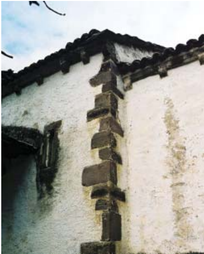
Fig. 4. San Vicente de Naviegu, siglo XIII. El entronque entre la nave y el tramo recto del presbiterio se refuerza con sillares de distintas dimensiones colocados alternado la disposición a soga y a tizón, como elemento de refuerzo estructural del edificio. El aparejo de la construcción es mampostería de caliza enripiada

la iglesia de Castañéu—, presente en construcciones como San Mamés de Tebongu, Santa María de Carceda, Santa María de L.lumés, San Pedru de Bimeda, San Vicente de Naviegu (fig. 4), Santa María de Xedrez y Santa María de Monasteriu d'Ermu (fig. 5), presentando algunos edificios trabajos de cantería en los lugares estructuralmente importantes del edificio, como ocurre en la iglesia de Naviegu.