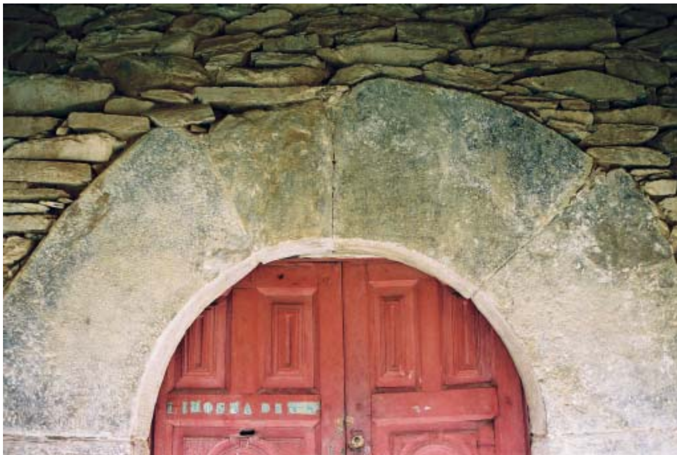
Fig. 3. Santa María de Castañéu, siglo XII. Paramento de mampostería enripiada por hiladas de caliza en la cual se procuran formar unas hiladas rústicas y se colocan las piedras tal y como llegan o ligeramente retocadas con martillo; los huecos se rellenan con ripio y esquirlas de piedras recubiertas de mortero por todos lados; apenas si se usan los cantos rodados. En los vanos de esta construcción aparecen los trabajos de cantería, tanto en la puerta lateral S. como en la puerta de ingreso por el O., presentando los mismos un acabado realizado con azuela y puntero

remodelaciones que los historiadores del arte fechan en los siglos XII y XIII y nada permanece de la primitiva fábrica de los siglos X y XI. Pero teniendo en cuenta el uso mayoritario de la mampostería en las actuaciones de los siglos XII y XIII, parece lícito pensar en la ausencia de trabajos de cantería en las obras del siglo XI, contrastando con otras construcciones realizadas completamente en sillares en el mismo período como San Pedro de Teberga. Esto puede ser un indicio del carácter local de la aristocracia que funda estos monasterios y financia las construcciones y de un escaso desarrollo de las fuerzas productivas que permita acometer actuaciones de mayor envergadura.