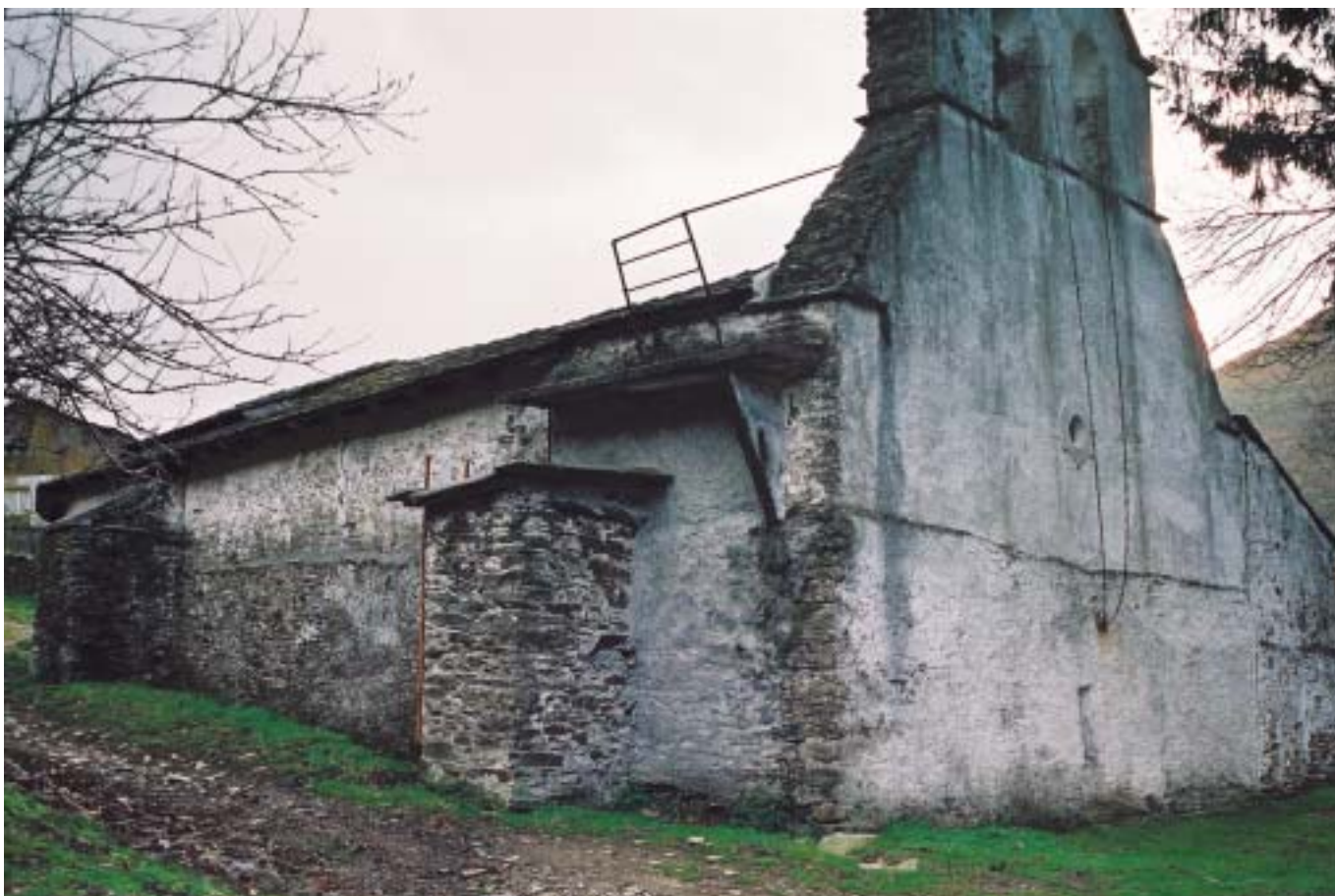
Fig. 7. Santa María de Vil.lacibrán. Siglo XIII. Construcción realizada con mampostería de pizarra