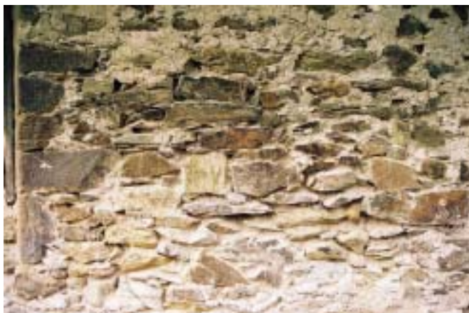
Fig. 6. San Vicente de Vil.latexil. Siglo XIII. Paramento de mampostería enripiada de pizarra que apenas forma hiladas rústicas, colocándose las lajas de pizarra sin apenas retoques, aprovechando su propio corte. Los huecos se rellenan con esquirlas de pizarra recubiertas de mortero por todos los lados. En el entronque de la nave con el presbiterio se utilizan lajas de mayor envergadura, apenas retocadas a martillo para facilitar la superposición de las hiladas