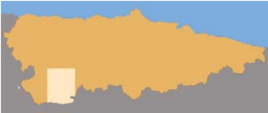
Fig. 1. Localización geográfica de la zona objeto de estudio

como ocurre con San Pedro de Teberga, sino que la utilización de las técnicas de cantería estará en relación con el nivel técnico local y con la capacidad económica de quien financia la construcción (FERNÁNDEZ MIER, QUIRÓS CASTILLO, 1999: 375).