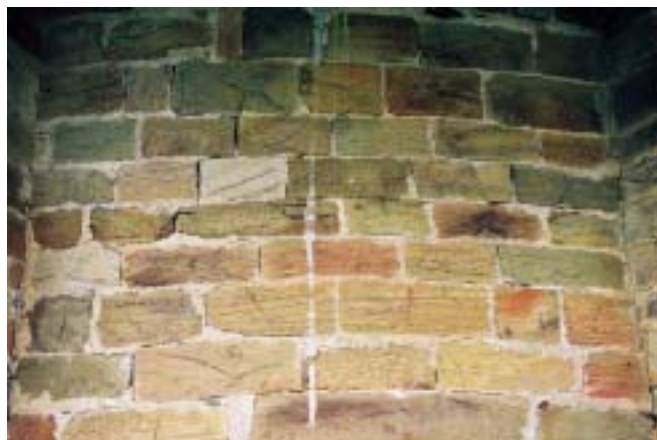
Fig. 8. San Miguel de Bárzana. Siglo XII. Presenta distintas técnicas constructivas que podrían datar de periodos cronológicos distintos. La cabecera está realizada en sillares de arenisca bien escuadrados, de pequeñas dimensiones, en los que apenas se aprecian las maestras que caracterizan el trabajo de sillería y con un acabado de las superficies realizado con azuela