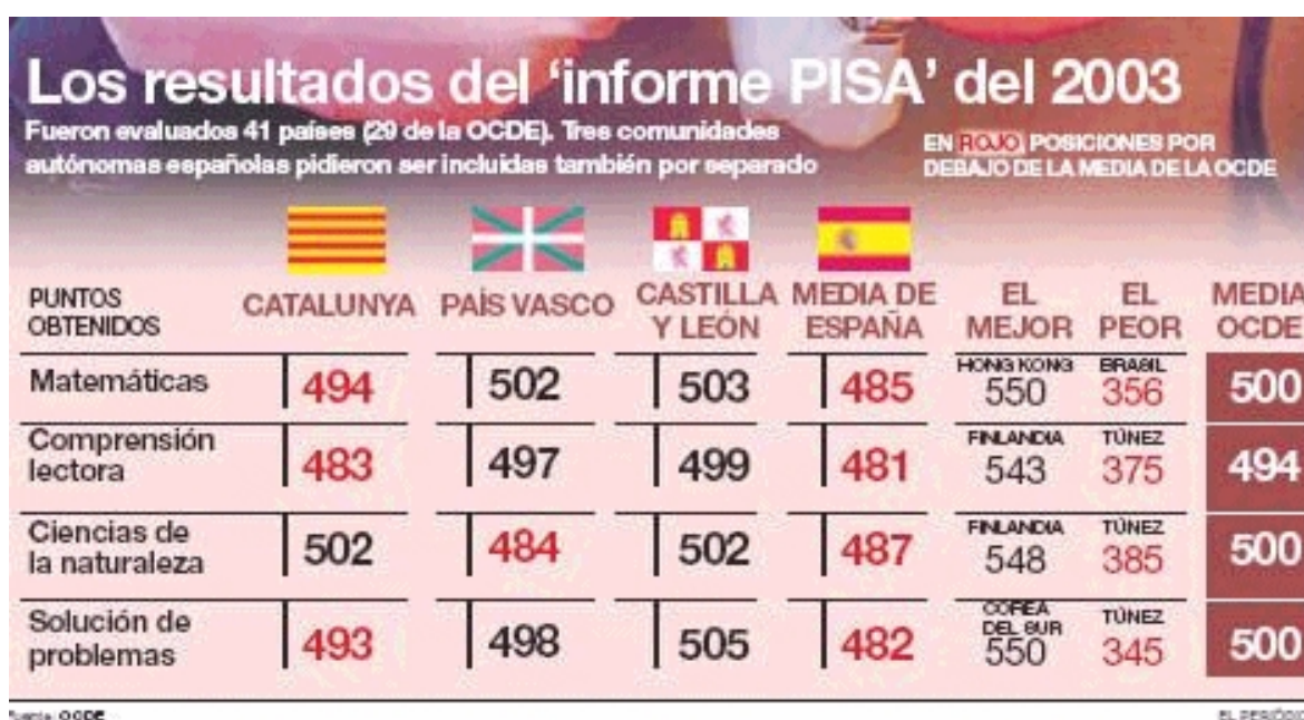
Figura 4.- Comparación de resultados de la aplicación PISA 2003.

Los resultados de las evaluaciones PISA, que se publican cada tres años junto a otros indicadores de los sistemas educativos, permiten a los administradores y gestores de la política educativa comparar el funcionamiento de sus sistemas educativos con los de los otros países y tomar decisiones en su ámbito nacional. También pueden ayudar a impulsar y orientar las reformas de la enseñanza y la mejora de los centros educativos, sobre todo en aquellos casos en que se obtienen peores resultados disponiendo de recursos similares. Además, estos resultados también son importantes para mejorar la evaluación y el seguimiento de la eficacia de los sistemas educativos.