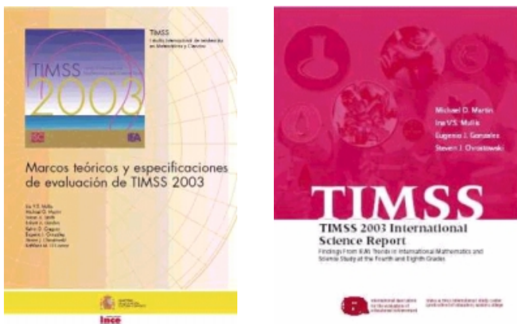
Figura 1.- Libros del TIMSS Trends 2003.

TIMSS es el acrónimo de Third International Mathematics and Science Study , un proyecto de evaluación internacional del aprendizaje escolar en matemáticas y ciencias realizado por la International Association for the Evaluation of Educational Achievement (IEA) 2 , que se aplicó en 1995 (Beaton et al. , 1996; Martin et al. , 1997; Mullis et al. , 1998). Puesto que en 1990 la Asamblea General de la IEA 3 decidió hacer sus evaluaciones de manera regular cada cuatro años, volvió a aplicarse en 1999 con el nombre de TIMSS Repeat (Martin et al. , 2000). En el año 2003 cambió su nombre a Trends in International Mathematics and Science Study , pero manteniendo el acrónimo que lo identifica (figura 1), por lo que éste se conoce como TIMSS Trends (Mullis et al. , 2002). España participó en 1995 (7º y 8º EGB), pero no lo ha hecho en las dos ocasiones siguientes, excepto la Comunidad Autónoma del País Vasco que sí ha participado en el año 2003.