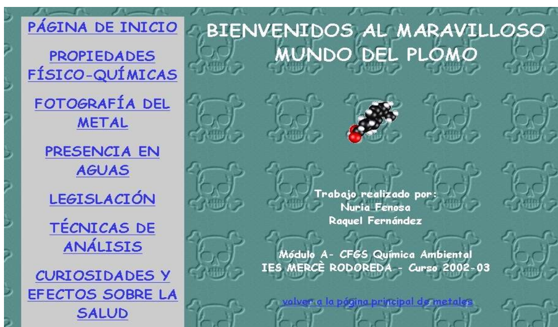
Figura 5.- Página principal del trabajo realizado sobre el plomo.

Una vez que el alumnado había adquirido las habilidades básicas del BSCW y del Netscape Composer, empezaron a trabajar sobre el proyecto asignado: cada grupo cooperativo debía realizar una serie de diferentes páginas web sobre un metal en concreto y su presencia y análisis en aguas. Cada grupo cooperativo, en cada grupo-clase, debía realizar el proyecto sobre un metal diferente. El sistema de derechos de acceso del BSCW permitía que todo el alumnado de un mismo grupo-clase pudiera ver el progreso y el trabajo del resto de compañeros de su grupo-clase y, por tanto, aprender con aquello que sus compañeros iban haciendo, además de compartir información en la carpeta de grupo-clase. Los proyectos asignados a los grupos cooperativos de los tres grupos-clase eran independientes y esto permitió que pudiera haber proyectos sobre el mismo metal en grupos-clase diferentes.