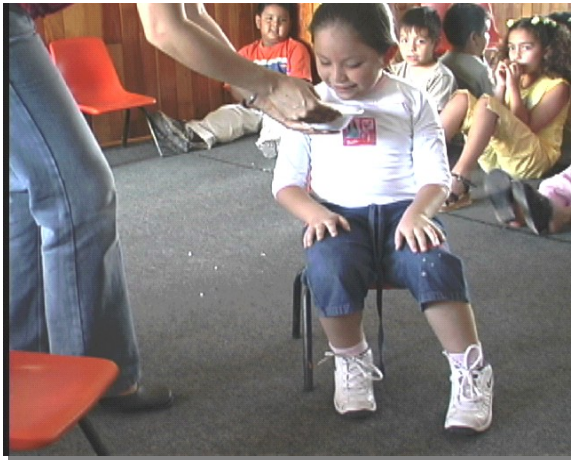
Figura 4.- Los niños pueden decir a qué sabe la papilla utilizando sólo el olfato.

parte superior de la cavidad nasal y 3) el cerebro, que se encarga de analizar e interpretar la información olfativa (figura 5).