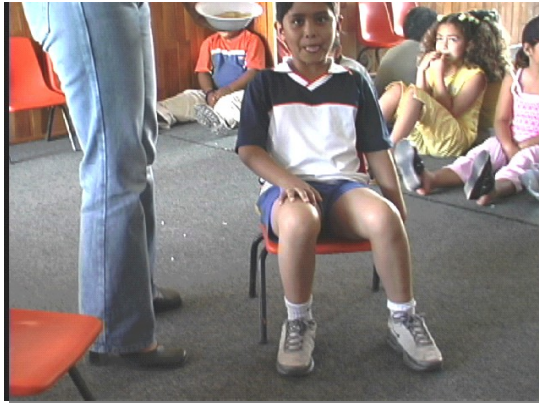
Figura 2.- La observación inicial de la conducta alimentaria se centra principalmente en los movimientos de la boca.