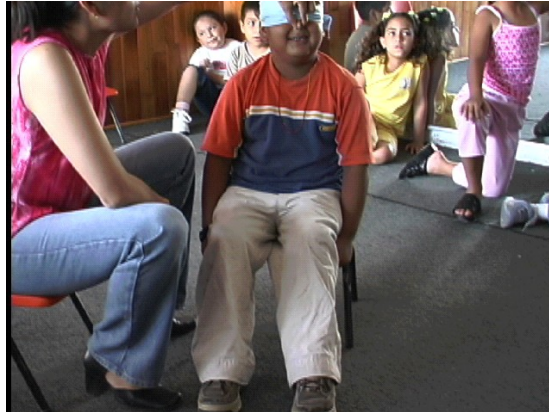
Figura 6.- Con los ojos tapados los niños sólo pueden emplear su sentido del olfato para identificar una fruta.

Tal como describimos en la primera experiencia, la percepción del sabor tiene los siguientes componentes: 1) una vía gustativa, 2) una vía olfativa y 3) la integración de estas dos vías en la corteza cerebral (Bermúdez-Rattoni, et al., 1988).