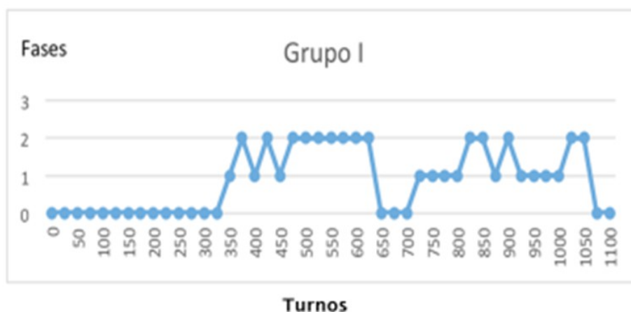
Gráfica 3. Turnos del Grupo I que discuten las diferentes fases del modelo.

La construcción del modelo no es lineal en ninguno de los grupos, puesto que alternan la discusión de las fases 1 y 2. Los tres grupos comienzan discutiendo las preguntas iniciales de la tarea (anexo 1), y a continuación pasan a discutir el modelo, en lo que invierten la mayor parte del tiempo de la sesión. Los grupos F e I discuten en primer lugar la fase 1, que retoman sucesivamente a medida que van consensuando los significados de los términos para la fase 2 de respuesta inmune. El grupo F invierte más tiempo discutiendo la fase 1 que la fase 2, ya que tienen dificultades para entender el significado de los elementos involucrados en esta segunda fase. A diferencia de este grupo, el H dedica casi la mitad del tiempo a discutir la fase 2, que es