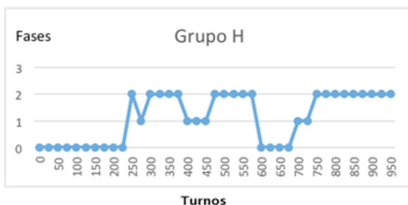
Gráfica 2. Turnos del Grupo H que discuten las diferentes fases del modelo.