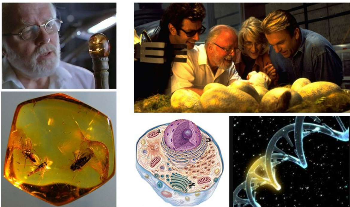
Figura 2. Parte del soporte visual utilizado para la tercera clase de la propuesta: la socialización de lo realizado en la Actividad II. Se combinan imágenes correspondientes a los fragmentos analizados de la película, con figuras representativas de conceptos biológicos utilizados para la crítica a los planteos y a la trama argumentativa.

Fue bueno ver la movilización que los estudiantes tuvieron que hacer de los conceptos teóricos de la disciplina. La forma de estudio que se les presentó condujo inexorablemente a una consideración de la teoría biológica (aprendida en las asignaturas básicas de la carrera de profesorado, Bioquímica, Organización Celular, Genética, Biología Evolutiva y Zoología I y II), como fundamento a la crítica de los planteamientos científicos con que se arma la trama del film (tabla 3). Con esto se vio la plausibilidad de los mismos. Fue muy evidente la escasa práctica que los estudiantes de profesorado tenían en lo que refiere a aplicar la teoría científica