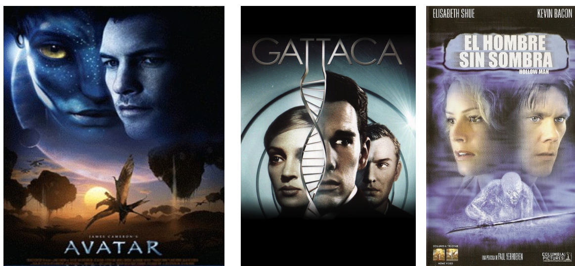
Figura 3. Películas de ciencia ficción como Avatar , Gattaca y El hombre sin sombra , fueron incluidas por los profesores practicantes como actividad central para el abordaje de distintos contenidos temáticos de biología en el nivel educativo medio. La motivación conseguida en los adolescentes y la significatividad de los temas disciplinares, se vio claramente aumentada por la utilización del recurso cine.

Es esto un ejemplo de aprendizaje situado ya que los conocimientos de las disciplinas son incorporados para entender una actividad que es parte de la cotidianidad del joven adolescente: mirar cine de ciencia ficción. Los conceptos de las ciencias que se aprenden en vinculación y directa aplicación a situaciones de la cotidianidad adquieren una significación y