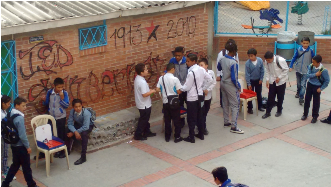
Figura 4. Casita de la paz. El proyecto surge como alternativa de actividades lúdicas durante los tiempos de descanso, con el fin de atenuar los conflictos surgidos en el patio durante improvisadas disputas de balones. Cada estudiante acude a la casita para solicitar juegos didácticos, canchas de mini-tejo y juegos de mesa.

Proyecto “y Vos-qué?”: Espacio de comunicación abierto para los estudiantes que están consumiendo o en riesgo de consumir sustancias psicoactivas. Fue abierto ante la negligencia de las instituciones de salud de brindar posibilidades reales de manejo del consumo a los adolescentes. Se ha convertido en un lugar donde es posible la escucha respetuosa de problemas y otras diversas situaciones familiares, así como también de la posibilidad de entender mejor las consecuencias del consumo de estas sustancias. La iniciativa ha logrado apoyar estudiantes en situaciones de consumo de sustancias psicoactivas, abrir las posibilidades de diálogo sin juzgar sus decisiones y posibilitar que puedan hablar abiertamente de lo que son y piensan.