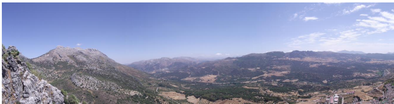
Figura 1. Panorámica del Valle del río Guadiaro (Fotografía del autor)

Como ya se ha mencionado, el Pleistoceno Medio-Superior viene caracterizado por las depresiones del Bajo Guadalquivir y del río Guadalete. En el Bajo Guadalquivir, las primeras evidencias de Pleistoceno Medio-Superior se documentan en las denominadas "terrazas altas" y "terrazas medias", formadas estas por un total de 7 terrazas (T5, T6, T7, T8 y T9, T10 y T11). De manera consecutiva a estas terrazas y enmarcada también en el complejo de "terrazas medias" aparece T12 como una terraza de transición hacia formas ya del Paleolítico Medio (presentes en T13). Para las "terrazas altas", se baraja una cronología de entre 780.000-300.000, evidenciándose una industria achelense clara pero escasa para los niveles T5 y T6 frente a la abundancia lítica de T7 a T9, destacando aquí la macroindustria sobre sílex. Por su parte, las "terrazas medias" de cronologías 300.000-80.000 y en especial T10 y T11 son la eclosión del achelense en el aspecto tecno-cultural. Secuencialmente, la terraza T12 supone como ya hemos comentado una fase de transición hacia las formas del Paleolítico Medio, presentando una perduración de las industrias en niveles anteriores (Vallespí, 1992: 67-69).