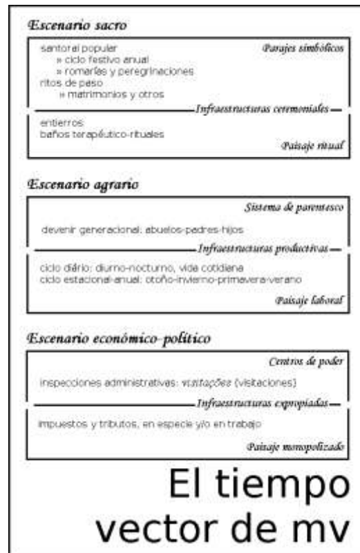
Figura 7. Cuadro esquemático del tiempo como vector del modo de vida rural medieval donde están indicadas los referentes diacrónicos principales (de cultura inmaterial) que son evidencia de cada escenario

El ciclo estacional-anual está encauzado a lograr excedentes de producción que cubran las prioridades alimentarias del futuro mediato; y la vida cotidiana está subordinada e integrada a éste. En ambos, la organización laboral del tiempo es cíclica, por lo que sus correlatos materiales contienen información diacrónica, que es factible deducir. Por ejemplo, la propuesta metodológica basada en el análisis del patrón de crecimiento de bivalvos para la inferencia de la temporada de recolección de moluscos así como del promedio de días dedicados a ello entre las comunidades de cazadoras-recolectoras de la Baja California (Mora 1982). Por su parte, el devenir generacional comprende un tiempo transgeneracional, que no ha estudiado la arqueología.