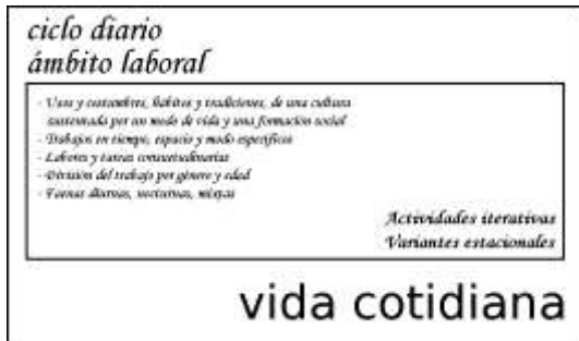
Figura 1. Cuadro esquemático de la vida cotidiana de una comunidad agraria, inherente al ciclo diario de actividades

itacate 15 de los que van al campo. Con esto hago explícito que la vida cotidiana se desarrolla en el contexto del ciclo estacional-anual.