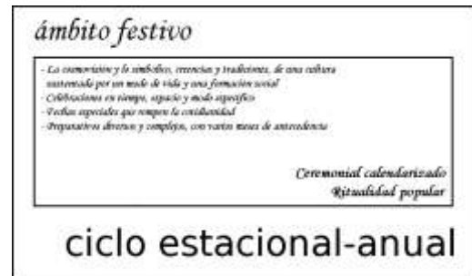
Figura 3. Cuadro esquemático del ciclo estacional-anual de una comunidad agraria tocante a las actividades ceremoniales calendarizadas

Tradicionalmente son actividades iterativas realizadas de año en año o, para algunas faenas, mediando períodos de varios años, como el descortezamiento del alcornoque ( Quercus suber ; "sobreiro", en portugués), en Marruecos y en la península ibérica, que se realiza de 9 a 14 años, para lo que hay que esperar de 30 a 50 años para obtener la primera corteza de corcho; o como la recolección del piñón ( Pinus cembroides y P. monophylla ) entre la comunidad K'myai de Baja California, Méx., y de California, EU, realizada cada 2 años (arql. Jorge Serrano González, comunicación personal, Mexicali, Baja California, 1989); o, como el cultivo del maguey pulquero ( Agave salmiana y A. atrovirens ) entre los pueblos nahua y otomí del altiplano central de México, cuyo su periodo de aprovechamiento intensivo empieza cuando esta suculenta alcanza la madurez, lo que tarda de 8 a 10 años. Esto ocasiona que sean de ciclo anual. Conjuntamente, también son actividades realizadas en el transcurso de las estaciones y de acuerdo con los ritmos de la naturaleza. Esto origina que sean de ciclo estacional. Por eso propongo, en una síntesis fundamental que retoma estas dos características esenciales, el concepto de ciclo estacional-anual (Figura 2). Además, siempre se debe tener presente que dependiendo de la labor, estas actividades requieren diferentes