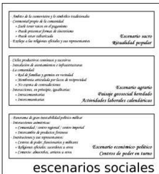
Figura 5. Cuadro esquemático de los escenarios sociales confrontados en el paisaje rural

heredado de la comunidad. Asentada en esta comarca, la comunidad está constituida, en esencia, por la red de familias y gremios en vecindad, que establecen una membresía articulada por lazos de filiación y laborales, de reciprocidad inmediata, mediata, diferida y condicional, no exenta de contradicciones de todo tipo. Las interacciones son, en alguna medida por determinar, igualitarias y se realizan principalmente entre los miembros de la comunidad (interacciones intracomunitarias), aunque también se pueden llevar a cabo interacciones con otras comunidades (interacciones intercomunitarias).