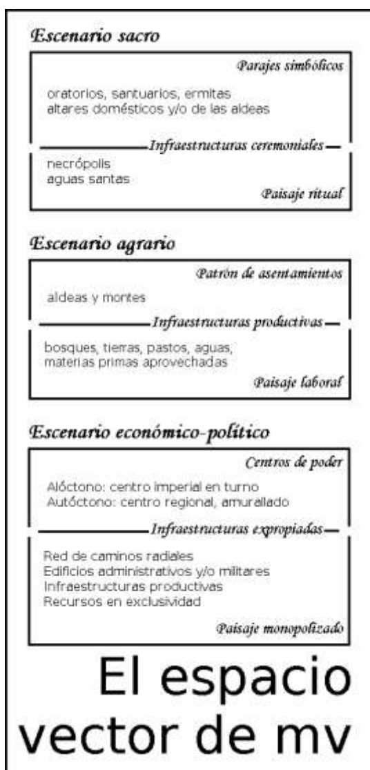
Figura 6. Cuadro esquemático del espacio como vector del modo de vida rural medieval donde están indicadas las principales infraestructuras (de cultura material) que son evidencia de cada escenario