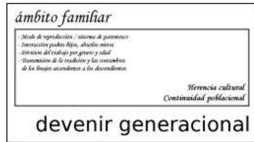
Figura 4. Cuadro esquemático del devenir generacional de una comunidad agraria tocante a la herencia cultural y a la continuidad generacional

ón cultural en los ciclos de vida y en los ritos de paso.