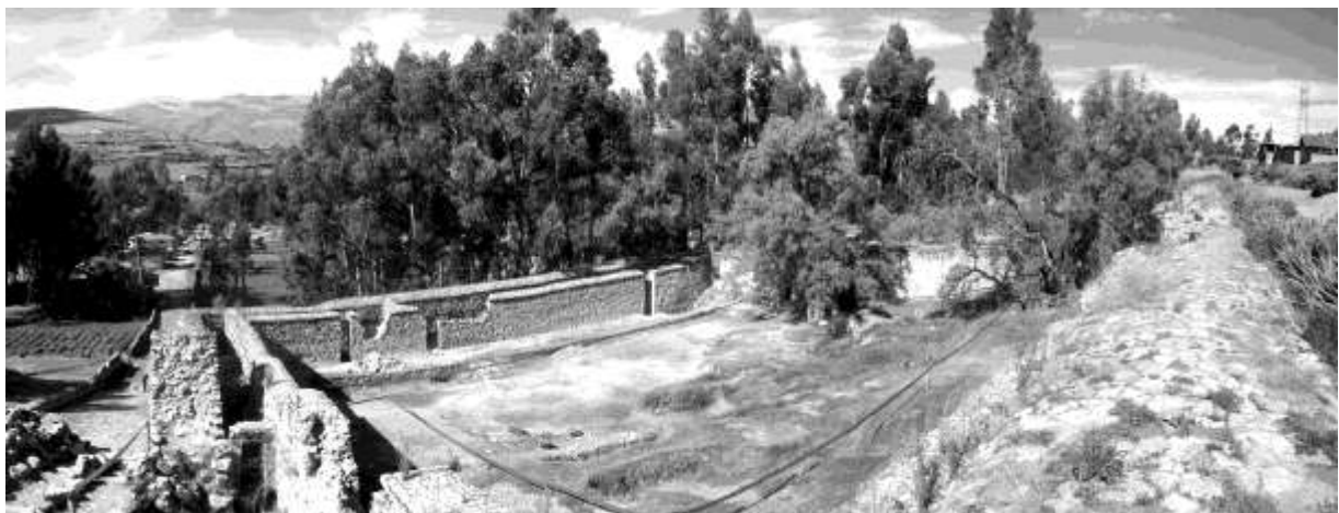
Figura 7. Vista panorámica del sitio de Wariwillka.

como pueden ser Conchopata, un sitio controlado directamente por el estado Wari, supone que las elites provinciales estaban reproduciendo a menor escala las tradiciones relacionadas con las prácticas sociales instauradas y realizadas en la capital en contextos oficiales dentro de los centros provinciales.