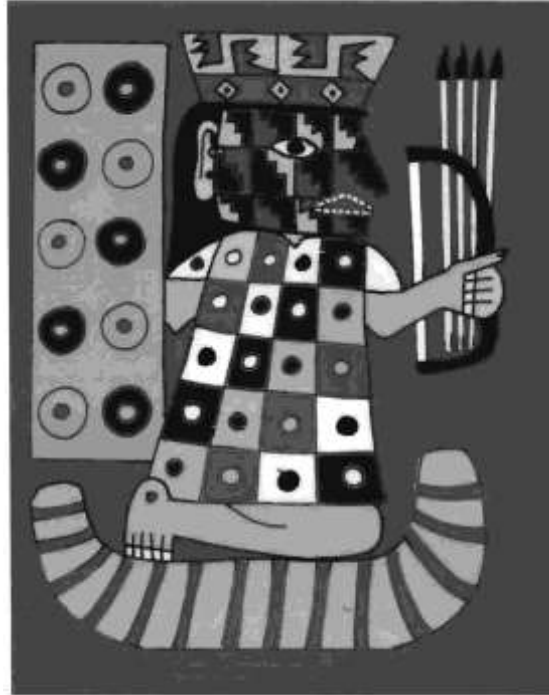
Figura 10. Motivo de personajes sobre vasija Wari con escudo, flechas y pintura facial sobre embarcación de totora. Tomado de Ochatoma y Cabrera 2000:10a