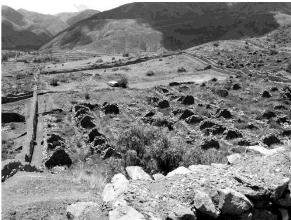
Figura 4. Vista de un sector del sitio Wari de Pikillacta.