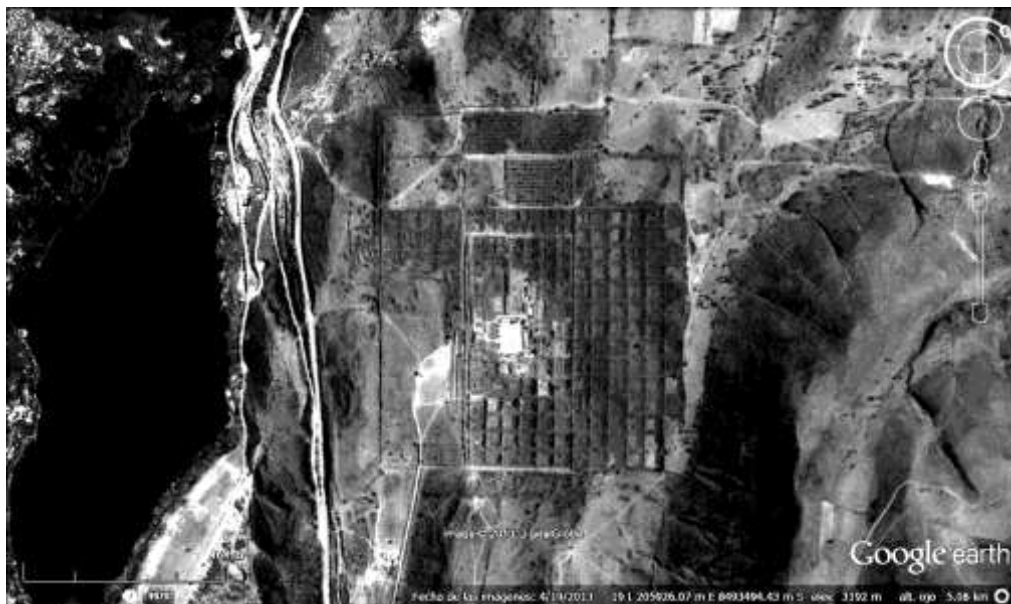
Figura 3. Vista de Google Earth del sitio Wari de Pikillacta, Cusco

Como diferentes imperios del mundo antiguo y dado que son proyectos subvencionados y controlados por el estado, es justamente en los nuevos sitios fundados donde se puede apreciar con mayor claridad los patrones arquitectónicos que se plasman en las áreas controladas. Justamente los principales sitios como Viracochapampa o Piki-lacta coinciden en establecer una norma en la construcción de centros provinciales. Otros sitios también lo hacen y aunque no son idénticos comparten características generales definidas por la elite que controla el imperio. Asimismo, además de administrar las nuevas regiones se convierten en espacios logísticos para expandir las fronteras u ocupar nuevas zonas de interés para el imperio. En esa dialéctica entre Wari y otras sociedades también puede darse el préstamo o emulación de estilos o elementos arquitectónicos ajenos a lo Wari.