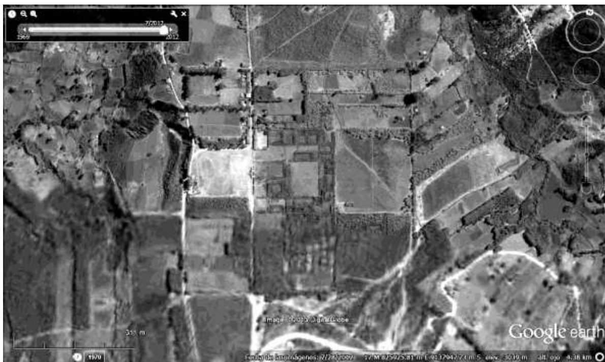
Figura 5. Vista de Google Earth del sitio Wari de Viracochapampa