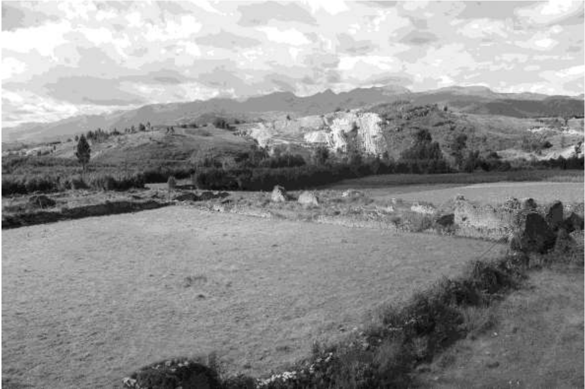
Figura 6. Vista de la Plaza principal del sitio de Viracochapampa.