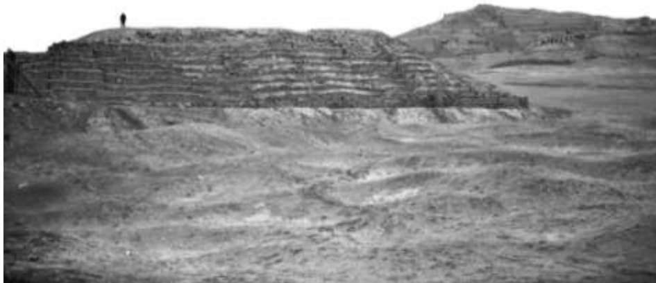
Figura 11. Vista del Templo de Pachacamac.