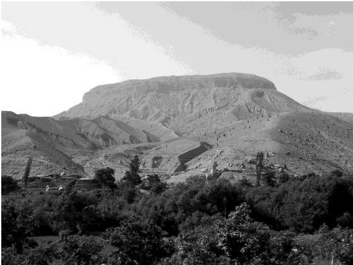
Figura 9. Vista de Cerro Baúl, Valle de Osmore, Moquegua.

te es reconocer que los artefactos llegados a estas tumbas no necesariamente establecen una relación directa con el Imperio Wari ya que bien podrían ser piezas de intercambio (ver indicador 33). Si, finalmente, encontramos que es un cementerio de poblaciones Wari (sobre todo si se hacen estudios bioantropológicos) este será uno de los mejores indicadores no solo de presencia Wari sino de ocupación y apropiación del territorio, física como ideológicamente.