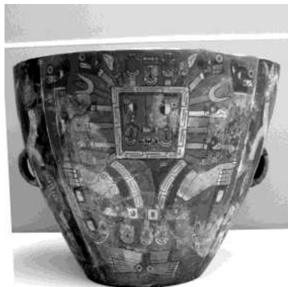
Figura 8. Vasija Wari de estilo Robles Moqo.