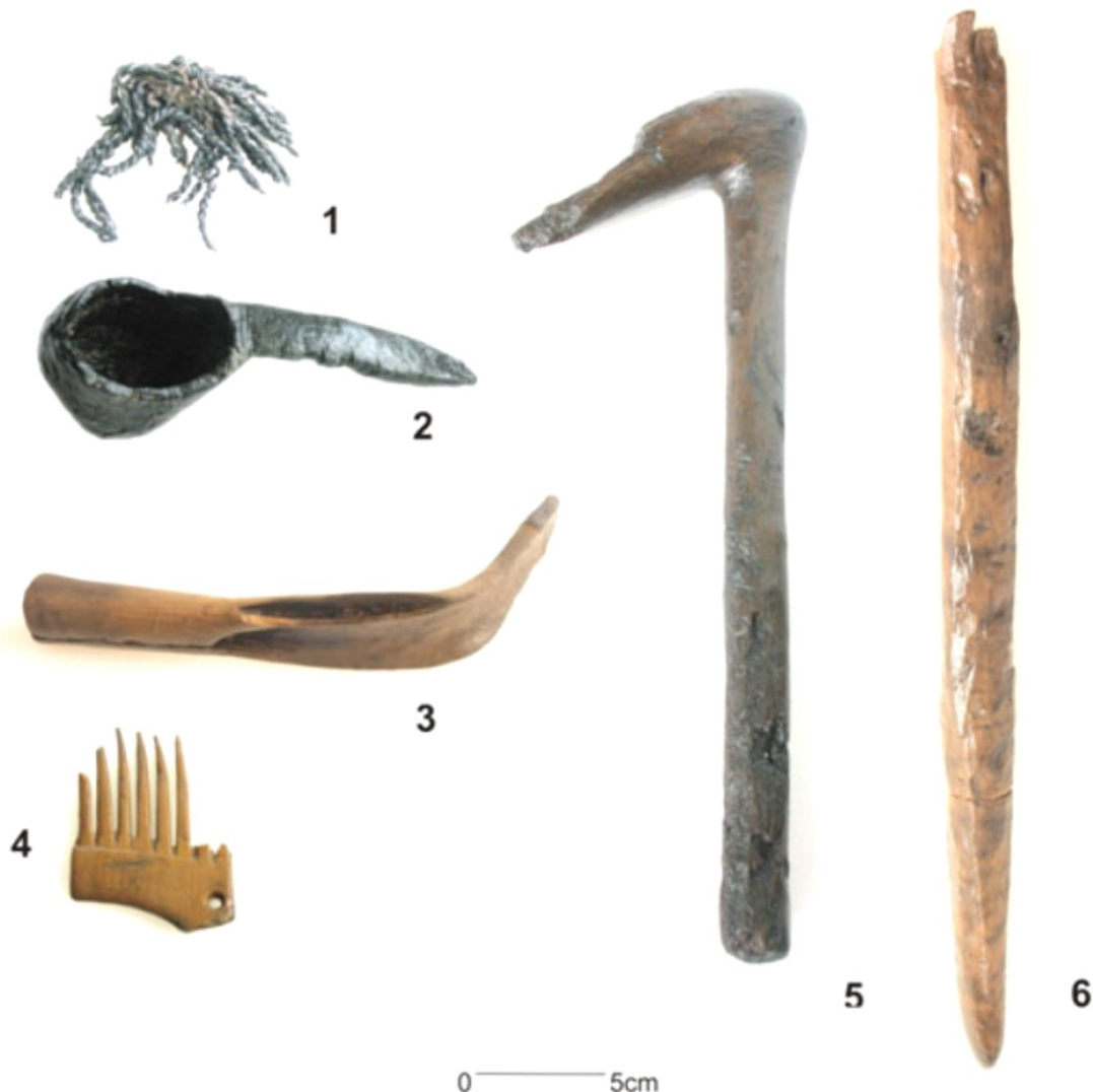
Figura 2. Objetos de madera del yacimiento neolítico de La Draga: 1. cuerda, 2. cucharón, 3. hoz, 4. peine, 5. mango de azuela, 6. palo cavador.

alrededor de una cuarentena de palos apuntados y biapuntados. Se trata de un conjunto que a priori puede parecer muy heterogéneo en lo que se refiere a materias primas empleadas para su fabricación ( Buxus, Quercus, Corylus, Laurus, Arbutus, Pomoideae ). También es heterogéneo en lo que se refiere a sus dimensiones (longitud y diámetro) y tipos de soporte empleados (ramas apenas apuntadas en sus extremos, cuartos y medios troncos segmentados). Por lo que parece que posiblemente nos encontramos en realidad con instrumentos que pudieron haber tenido usos diversificados