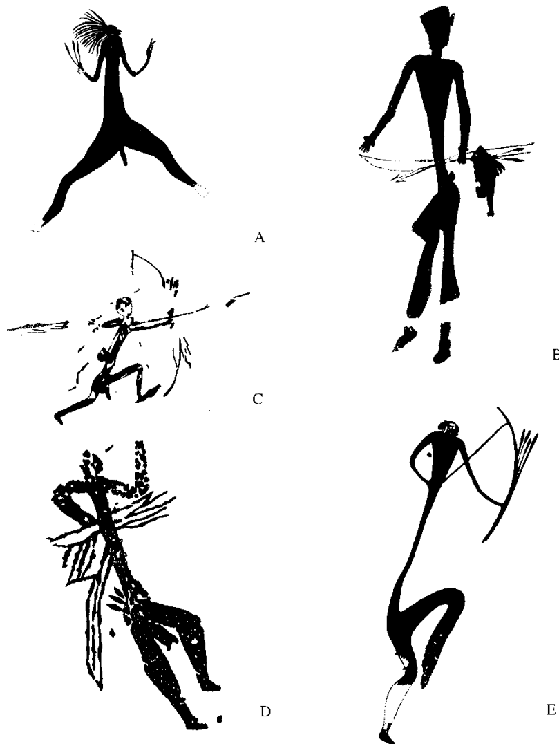
A: Cueva de la Vieja (Alpera, Albacete). Según Cabré (1915: fig. 97). B: Abrigo del Ciervo (Dos Aguas, Valencia). Según Jordá y Aleacer (1951: lám. III). C: Cueva Remigia (Ares del Maestre, Castellón). Según Viñas y Sarria (1978: Fig. 2). D: Benirrama (Vall de Gallinera, Alicante). Abrigo I. Panel 4. Según Hernández, Ferrer y Catalá (1988: fig. 265). E: Covas dels Civil o Ribesals (Tirig, Castellón). Abrigo III. Según Obermaier y Wemert (1919: lám. VII).

se han encontrado dos arcos, mientras que en cambio se encontraron siete hoces y una cuarentena de palos apuntados y biapuntados lo que refuerza la idea de la mayor importancia de las actividades agrícolas y ganaderas (Bosch et al. 2006). Esta diferencia pone de manifiesto que lo que se muestra socialmente y se socializa al resto de la comunidad por los poderes dominantes, no se corresponde con lo que realmente sucede (actividades económicas) en los asentamientos documentados en los yacimientos registrados, como La Draga