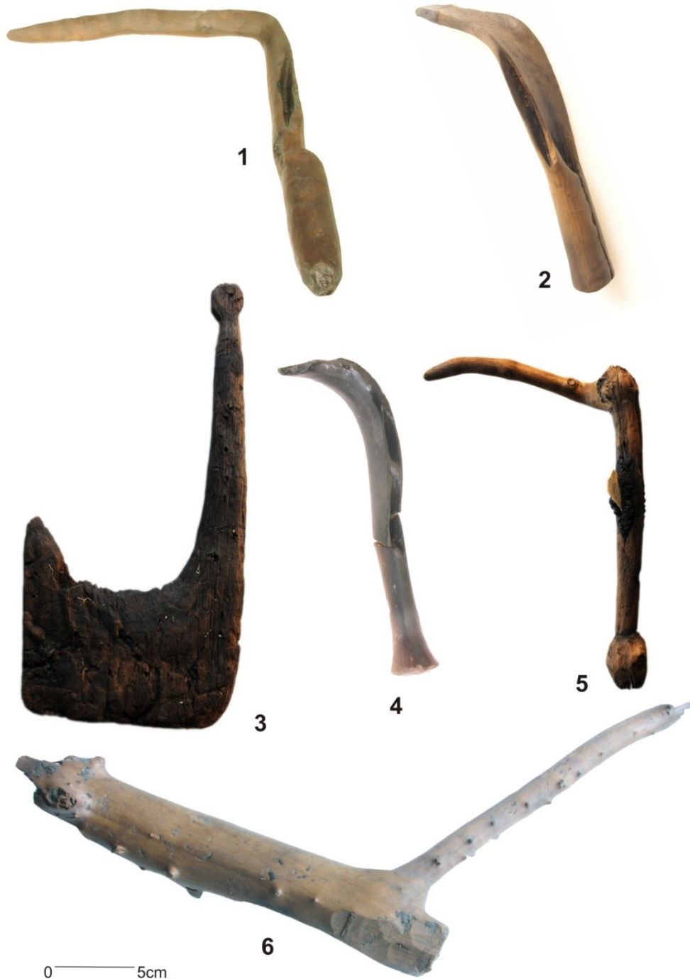
Figura 3. Hoces de madera del yacimiento neolítico de la Draga. 1 a 5 mangos de hoz y hoces. 6 mango en proceso de elaboración.

las personas que la llevaban a cabo. Hemos visto que en las necrópolis los proyectiles están principalmente asociados a individuos masculinos, cronológicamente estas necrópolis son más recientes que La Draga pero este rasgo es recurrente incluso en necrópolis de cronologías diferentes.