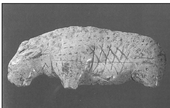
Figura 1. Felino de 8'8 cms. de largo hallado en el horizonte IV de Vogelherd. Procedencia: Hahn, 1986.

Los principales yacimientos del sur de Alemania con arte auriñaciense de pequeñas estatuillas son los sitios de Vogelherd, Hohlenstein- Stadel, Geissenklösterle y Hohle-Fels. Los cuatro están situados en dos afluentes próximos del Danubio y están separados entre sí por apenas unos kilómetros. Vogelherd y Hohlenstein-Stadel se encuentran en el valle del Lone