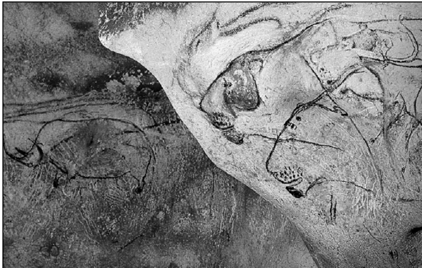
Figura 5. Leones en la Salle du Fond de Chauvet. Procedencia: Clottes, 2001.

De la misma manera, se puede comparar el modo de representar la cabeza de algunos caballos en Chauvet con los dos caballos conocidos de Vogelherd y de Hohle Fels. Las similitudes son notables: en los dos casos se representa la crin, los ojos, y el hocico y en ambos casos la curva que sirve para representar la mandíbula inferior tiene una forma muy similar.