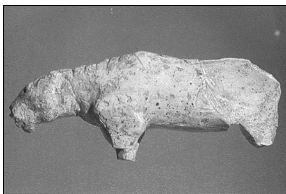
Figura 2. Felino de 6'8 cms. de largo hallado en el horizonte V de Vogelherd. Procedencia: Hahn, 1986.

mientras que Geissenklösterle y Hohle-Fels están en el valle del Ach.