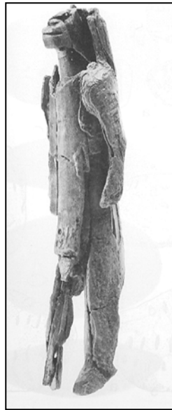
Figura 4. Hombre-león de 28'1 cms. de alto procedente de Hohlenstein-Stadel IV. Procedencia: Hahn, 1986.

reconstrucción de la pieza. Dicha reconstrucción fue concluida en 1988 por Elisabeth Schmid dando lugar al famoso “hombre-león” de Hohlenstein (Figura 4).