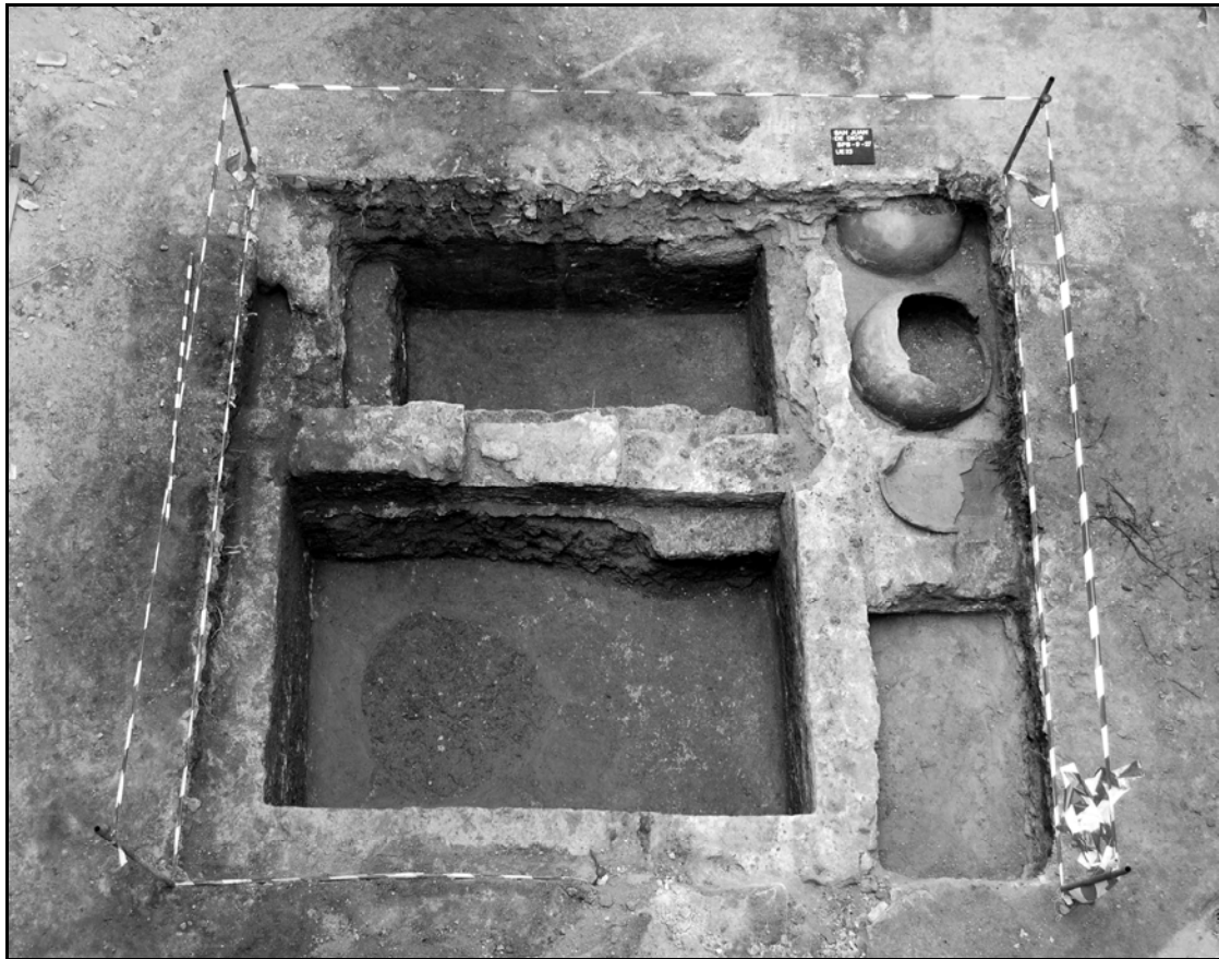
Figura 2. Estructura exhumada en el segundo patio del Hospital de la Misericordia, perteneciente a la Carnicería Mayor. Se trata de una gran pileta colmada con restos provenientes de los trabajos de despiece del ganado.