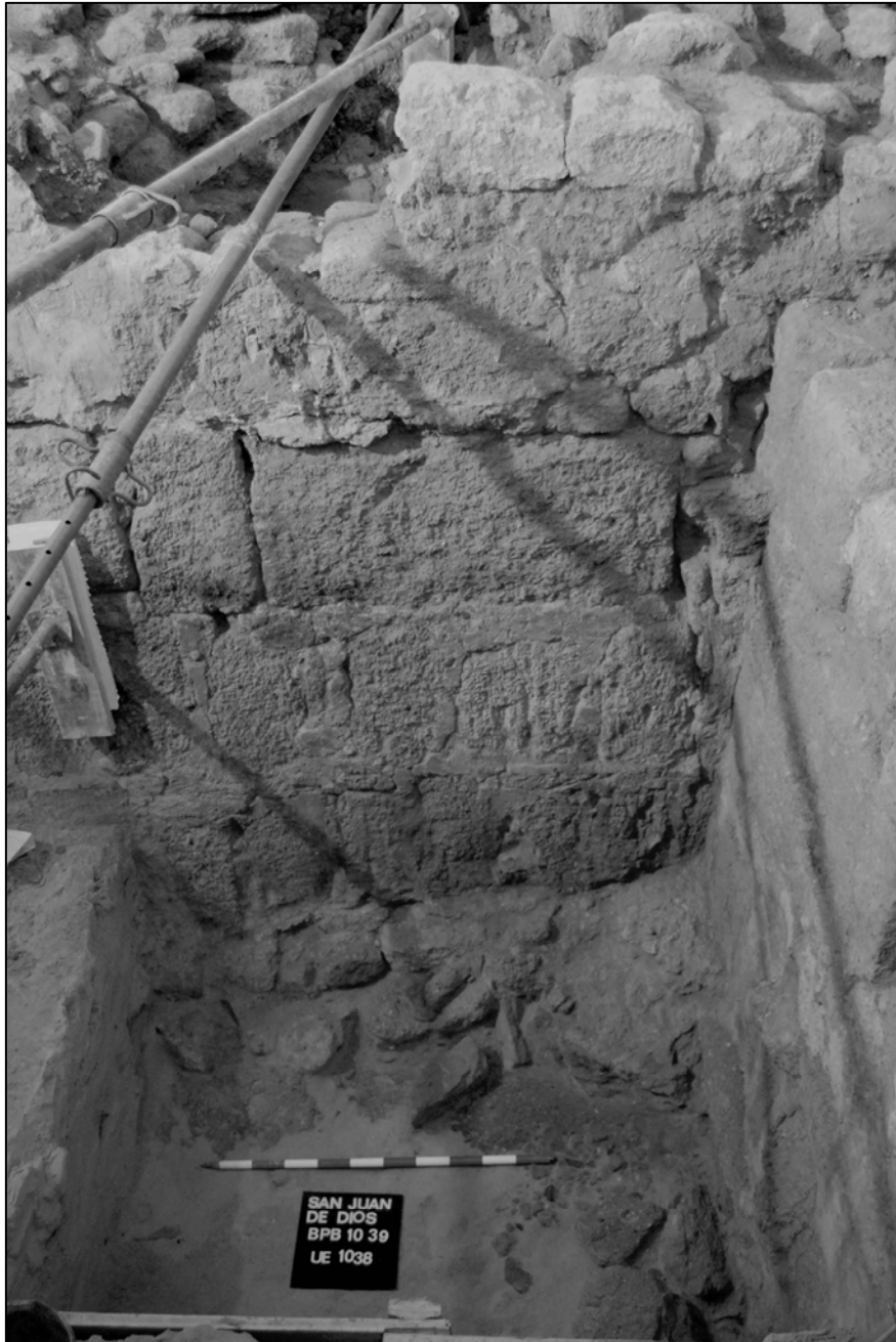
Figura 4. La muralla aparecida en el sondeo arqueológico realizado junto a la calle Posadilla, que muestra claramente la estructura de la misma, de grandes sillares y revoque hidráulico en las juntas. En este lugar se proponía la existencia de una torre. Los resultados arqueológicos indican que ésta se ubicaba, más bien, al interior de la muralla, a modo de torre-puerta.

este tramo de la cerca donde se puede observar la fábrica predominante en el alzado, mampuesto en piedra, y que debe corresponder a las numerosas remodelaciones y reparaciones realizadas en época cristiana, pero sin variar el trazado la misma.