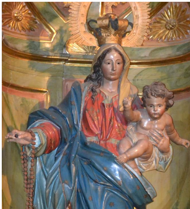
Imagen 5. Virgen del Rosario (detalle). Iglesia parroquial de Navarrete (La Rioja)