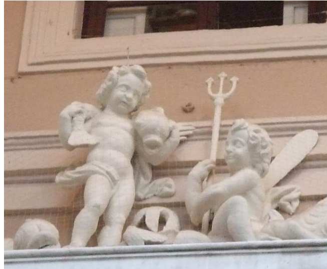
Imagen 10. Tritones. Edificio del Ayuntamiento (Cádiz).

Estos ángeles tendrán unas características comunes, que ya están presentes en la imagen de la Virgen del Rosario. Suelen ser niños de ojos pequeños, mejillas regordetas y cuello ancho. Tienen los cabellos rizados, por lo general con un mechón en la parte delantera que cae sobre la frente, mientras el resto de los rizos se arremolinan en torno a las orejas. Sus expresiones suelen ser comedidas, pero aun así se pueden apreciar diferencias entre unos y otros: los ángeles de la Virgen del Rosario de Navarrete se miran con una divertida complicidad, el niño del monumento funerario de Federico Gravina llora mientras se enjuga las lágrimas con un paño, los ángeles de La comunión de san Estanislao de Kostka contemplan la escena con expresión admirada y reverente y los pequeños tritones del Ayuntamiento de Cádiz intercambian una mirada traviesa.