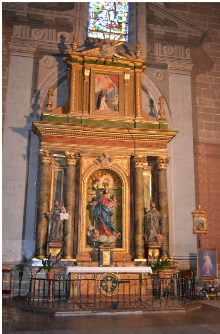
Imagen 1. Retablo de Nuestra Señora del Rosario. Iglesia parroquial de Navarrete (La Rioja)