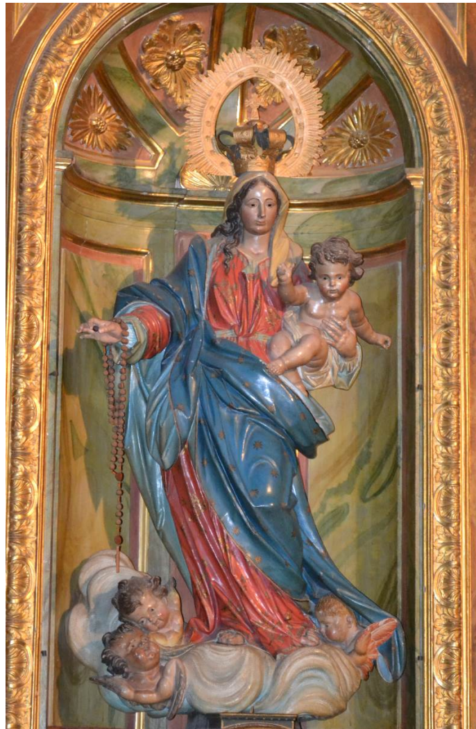
Imagen 2. Virgen del Rosario. Iglesia parroquial de Navarrete (La Rioja)

La coincidencia de las fechas, el hecho de que la figura proceda de Madrid, la relación de Cosme con los artífices del retablo y la influencia de Michel en el modelo iconográfico y en los aspectos técnicos de la figura nos permiten identificar esta figura con la Virgen del Rosario realizada por Cosme Velázquez para la localidad de Navarrete.