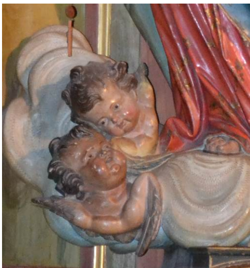
Imagen 7. Virgen del Rosario (detalle). Iglesia parroquial de Navarrete (La Rioja)