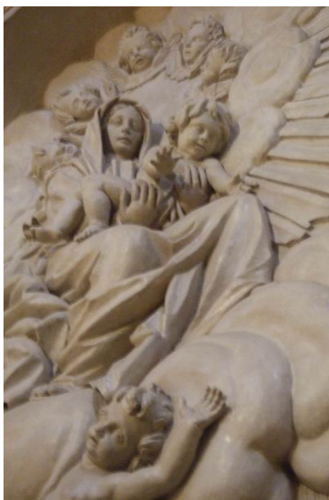
Imagen 6. La comunión de san Estanislao de Kostka (detalle). Oratorio de la Santa Cueva (Cádiz)

El dinamismo del Niño, tanto en uno como en otro caso, requiere un gran dominio de la anatomía infantil, lo cual nos muestra el otro rasgo que indicábamos del estilo de Cosme Velázquez: su maestría en la representación de niños. De hecho, en esta obra contrasta el tratamiento del rostro de la Virgen, algo más tosco y desdibujado con la maestría que el