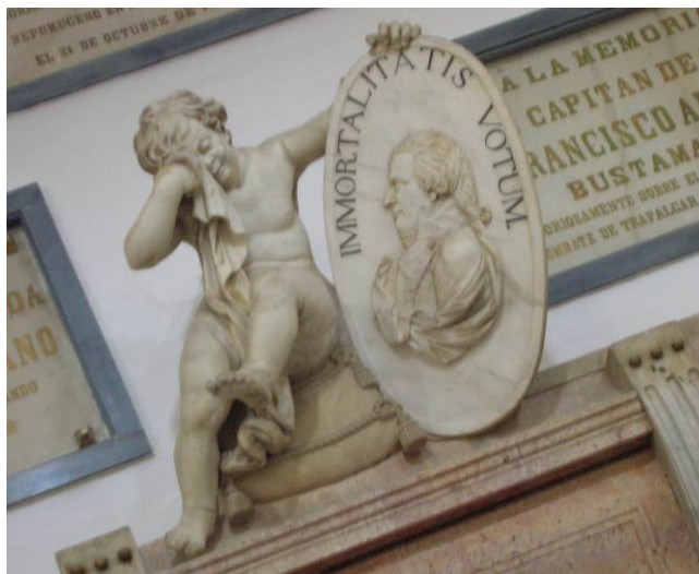
Imagen 8. Sepulcro de Federico Gravina (detalle). Panteón de Marinos Ilustres de San Fernando (Cádiz).