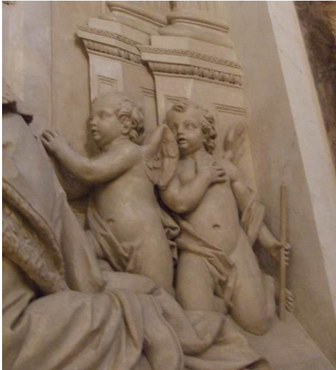
Imagen 9. La comunión de san Estanislao de Kostka (detalle). Oratorio de la Santa Cueva (Cádiz)