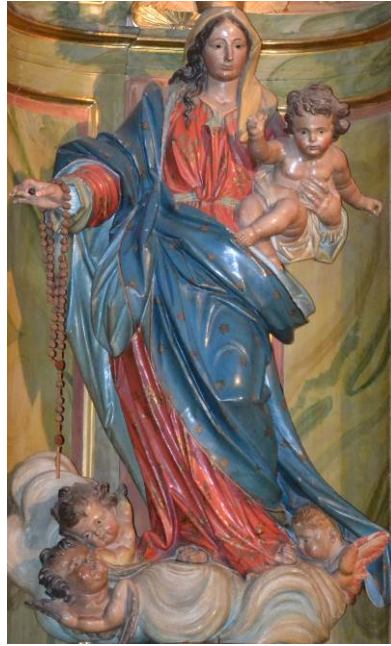
Imagen 3. Virgen del Rosario (detalle). Iglesia parroquial de Navarrete (La Rioja)