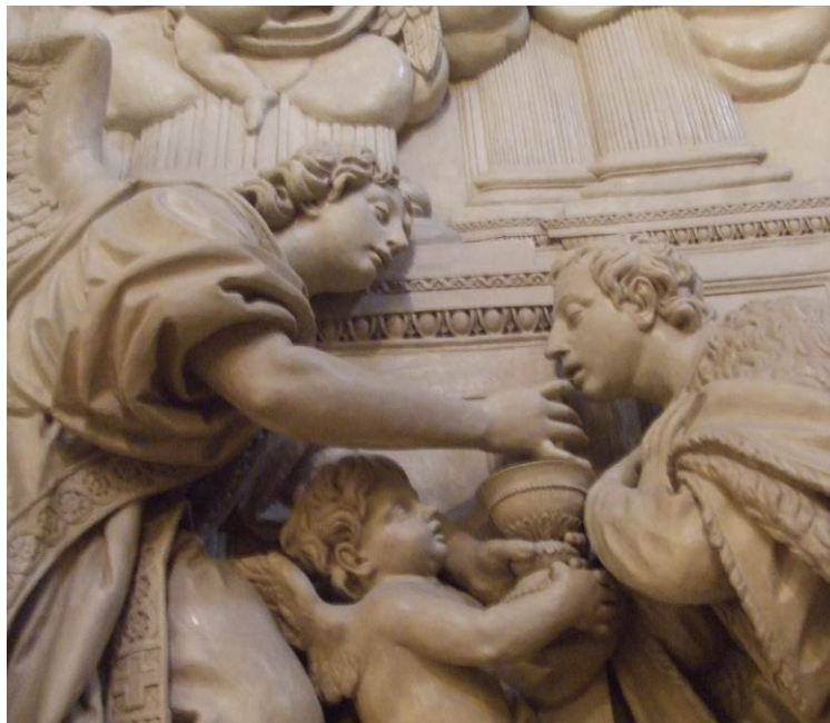
Imagen 4. La comunión de san Estanislao de Kostka (detalle). Oratorio de la Santa Cueva (Cádiz)

Se puede concluir que la imagen de la Virgen del Rosario de Navarrete muestra un estilo mucho más cercano al rococó con influencia flamenca de Roberto Michel mientras que en obras posteriores Cosme Velázquez irá tendiendo hacia un estilo mucho más clasicista por influencia del academicismo.