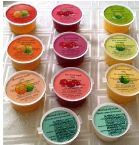
Рис. 1 – Зразки желе плодово-ягідного для випробування

Дослідження проводили з використанням уронатного полісахариду – пектину низькоетерифікованого амідованого (ПНЕА) «NECJ-A1». Напівфабрикат желуючий для солодких страв (НЖСС), одержували із використанням функціональної желеподібною системи за участі ПНЕА та іонів кальцію. Зразки, що підлягали випробуванню, наведено на рис. 1.