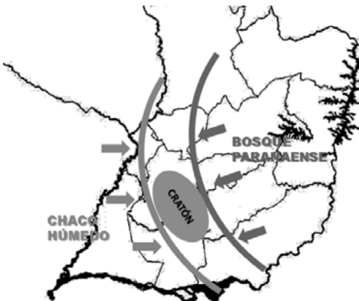
Fig. 4. Diagrama esquemáticos de la confluencia de ecorregiones en el Sur de Paraguay. El Chaco Húmedo al oeste estaría asociado a la evolución propia de las llanuras aluviales de la cuenca del río Paraguay; El Bosque Paranaense se asocia a la elevación del terreno y la presencia de suelos profundos. En el área de transición, la presencia del Cratón de Caapucú sugiere una historia evolutiva diferente a las anteriores, y se asocia a las sabanas de pajonales.