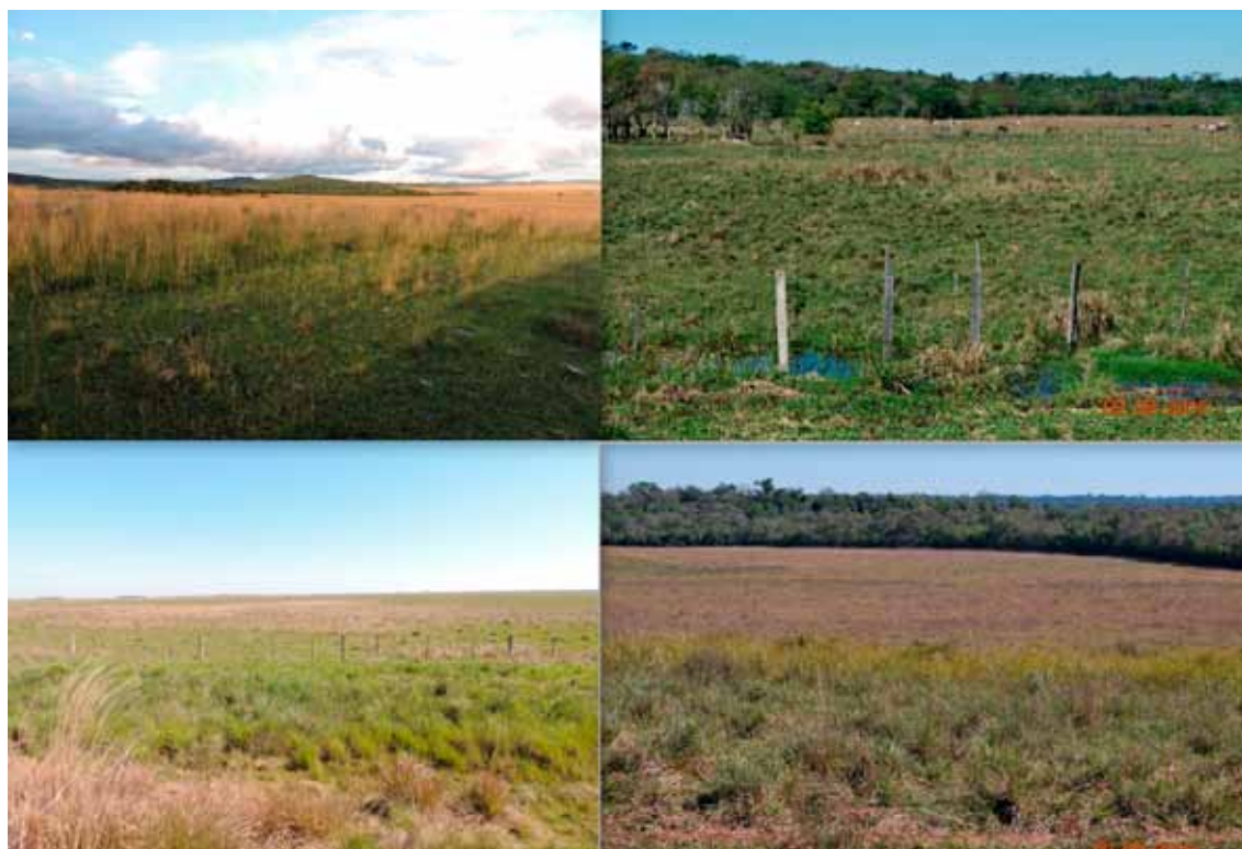
Fig. 2. Paisajes de sabanas herbáceas de la región de estudio. Arriba a la Izq: Pajonales de Caapucú, sobre el afloramiento cristalino (Foto: JL Cartes); Arriba Der: Pastizales hidromórficos de San Pedro del Paraná (Foto: JL Fontana); Abajo Izq: Pastizales hidromórficos de Caazapá, camino a Yegros (Foto: JL Cartes); Abajo Der: Pajonales de Kanguery en el límite con la selva paranaense (Foto: JL Fontana).

la cobertura boscosa densa, del tipo Bosque Paranaense; b) los procesos sedimentarios cuaternarios de la amplia cuenca del río Paraguay, antiguamente correspondiente a intrusiones marinas o posteriores cuencas hídricas, corresponderían a las llanuras aluviales del Chaco Húmedo con su sabana palmar de suelos limo-arcillosos negros; c) los procesos de elevación y erosión de la Suite Magmática de Caapucú, sumado al intenso magmatismo y procesos metamórficos producen un área que presenta una historia evolutiva diferente a las anteriores, y un extenso proceso de desgaste hasta llegar a suelos alfisoles y entisoles muy pobres y ácidos, (Cubas et al. 1998). En esta región predominarían las sabanas herbáceas, con dominio de pajonales. Este patrón se resume diagramáticamente en la Figura 4.