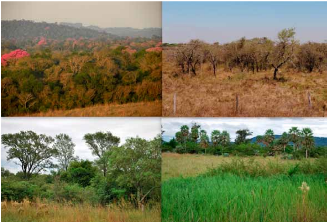
Fig. 3. Paisajes leñosos de la región de estudio. Arriba a la Izq: Bosque Subtropical Húmedo Semicauducifolio, correspondiente a los Bosques Paranaenses (Foto: JL Cartes). Nótese los lapachos florecidos ( Handroanthus heptaphyllus ); Arriba Der: Matorral de ñandubay, en cercanías de los esteros del Ñembucú, camino a Pilar (Foto: JL Cartes); Abajo Izq: Bosque chaqueño húmedo, con presencia de quebracho colorado ( Schinopsis balansae ) Foto: JL Fontana; Abajo Der: Sabanas hidromórficas de origen aluvial con presencia de palmas de karanda'y ( Copernicia alba ) Foto: JL Fontana.