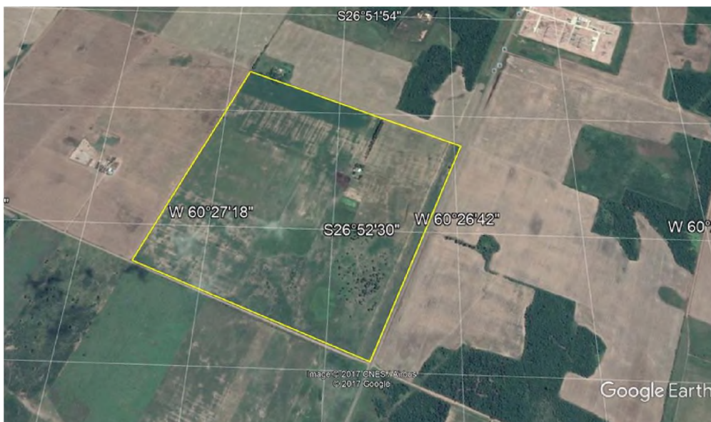
Gráfico N°1: Ubicación del Parque Solar Fotovoltaico, vista del terreno superficie del (1000 m x 982m), en la parte superior se puede ver la cercanía a la Estación Transformadora de 500KV Sáenz Peña. Sobre RN95.

Las leyes de la provincia del Chaco exigen que se cumplan el procedimiento de EsIA, a través de su autoridad ambiental regulatoria, que es el Ministerio de Planificación y Ambiente.