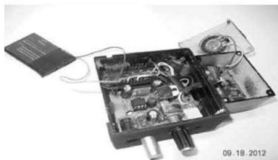
Fig. 4 bastón electrónico para ciegos