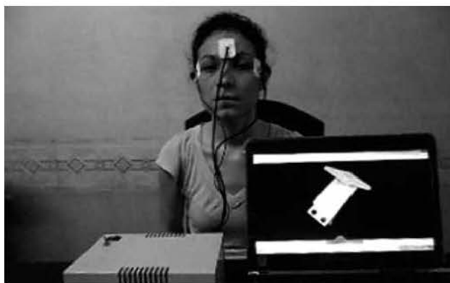
Fig 5 Registrador electrooculografico