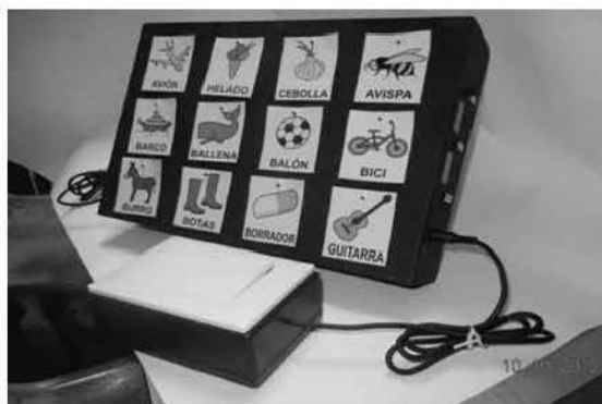
Fig 3 Comunicador pictográfico

Consiste en un comunicador de aproximadamente 40 por 50 cm que contiene pictogramas de 8x8 cm distribuidos en columnas. A cada dibujo le corresponde una luz (LED) que se enciende secuencialmente. Cuando el niño desea señalar aquel dibujo que le indicaron que lo identifique, oprime un pulsador de tecla o uno de cero esfuerzo. Allí se detiene la secuencia y un sonido indica que fue detectado correctamente. Existen varios modos de recorrer el conjunto de pictogramas. Si bien este dispositivo puede implementarse con una PC o notebook, tiene la posibilidad de ser trasladada a ambiente donde no hay energía eléctrica o en un entorno más relajado como un parque o patio.