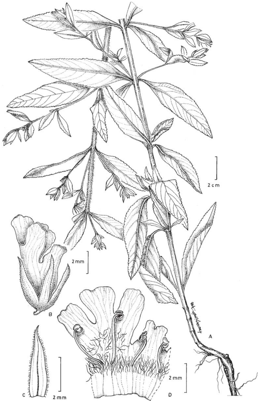
Fig. 1. Stemodia pratensis . A: planta. B: flor. C: detalle de un sépalo. D: corola abierta mostrando los tricomas y los estambres (A-D, Seijo et al. 3703).