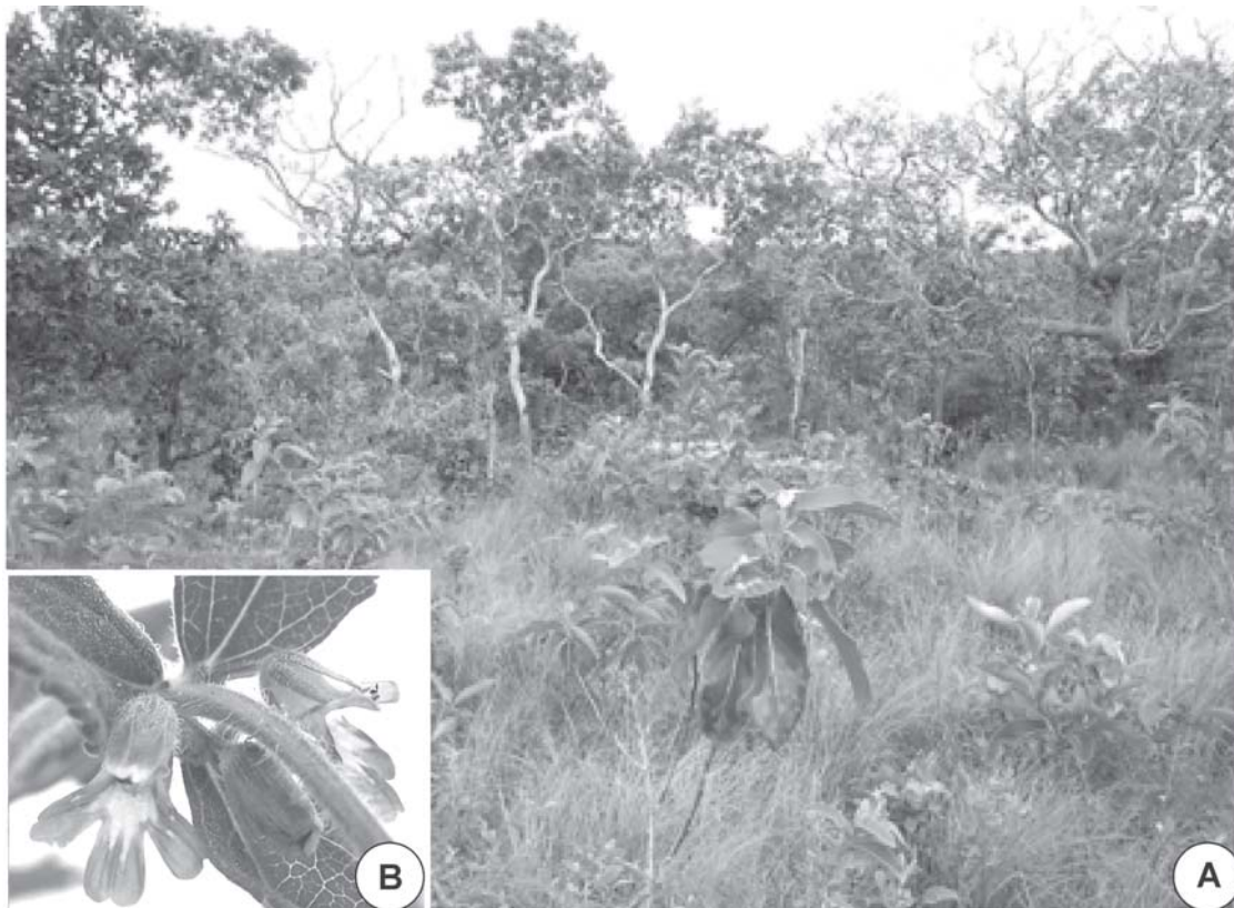
Fig. 2. A: cerrado húmedo donde crece Stemodia pratensis en Bolivia. B: detalle de una rama florífera de Stemodia pratensis .