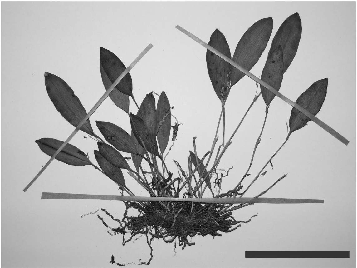
Fig. 2. Anathallis brevipes (G.M. Marcusso & P.R. Sanine 130, HRCB). Escala: 6 cm.