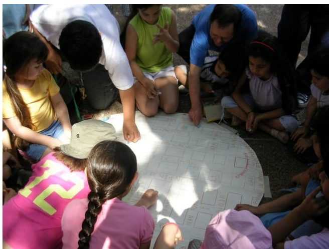
Ilustración 1. Actividad de recreación popular en la plaza. 2006.

Los integrantes de La Oruga pensábamos nuestro trabajo en torno a tres ejes fundamentales: la educación popular, la recreación popular y la ocupación del espacio público. La educación fue concebida por el colectivo como una herramienta para el