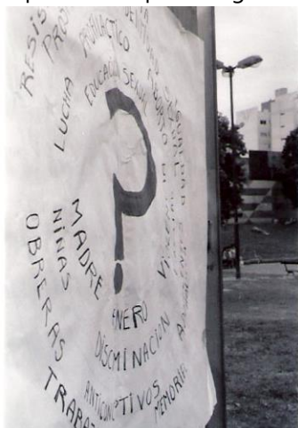
Ilustración 10. Actividad por el día de la mujer.

“...QLP no es un periódico panfletario, ni el órgano de difusión de las actividades de La Oruga. No se trata de estancarse en una posición en cuanto a los distintos temas que puedan tratarse, sino de abrir el juego, el debate, a través de las fisuras que deja el discurso de sentido común que circula por los grandes medios y que tiene eco en la vida cotidiana. Y a partir de ahí intentar construir conocimiento colectivo desde nuestra realidad, en diálogo con el barrio” (Propuesta del periódico barrial Qué lo Parió para los proyectos UBANEX, 2009).