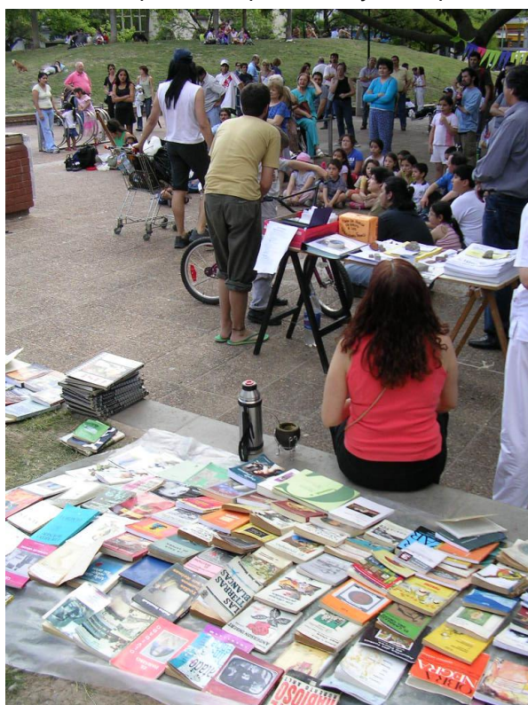
Ilustración 2. Biblioteca de La Oruga. 2006.

El debate sobre la legitimidad y la eficacia del arte cambia de escenario en la crisis del 2001. Los partidos políticos y el aparato estatal sufren un proceso de acelerada