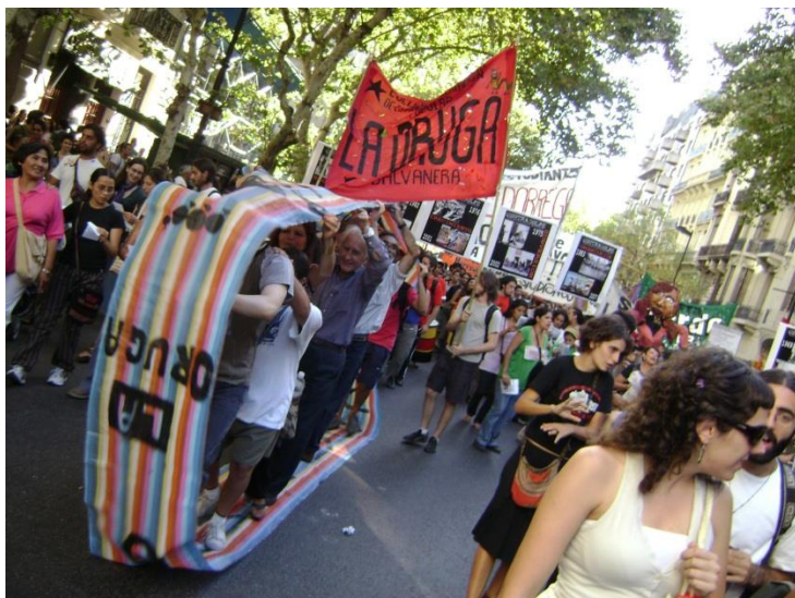
Ilustración 6. Marcha en oruga. 24/3/2008

En la marcha convocada por los organismos de derechos humanos la organización intervenía poniendo en juego la dinámica de la cual surge su propio nombre. La técnica