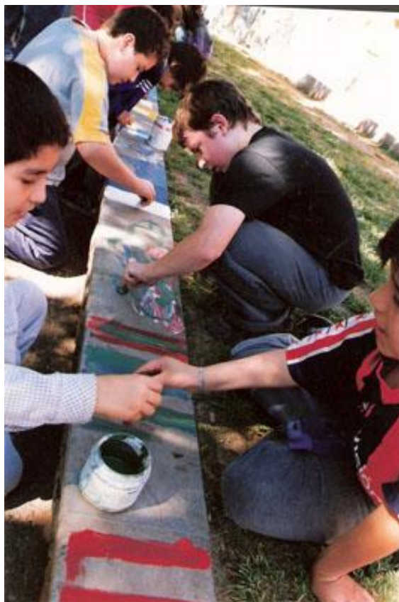
Ilustración 3. Taller de expresión plástica. 2006.

niños, en varias ocasiones con sus padres que eran convocados para compartir algunas