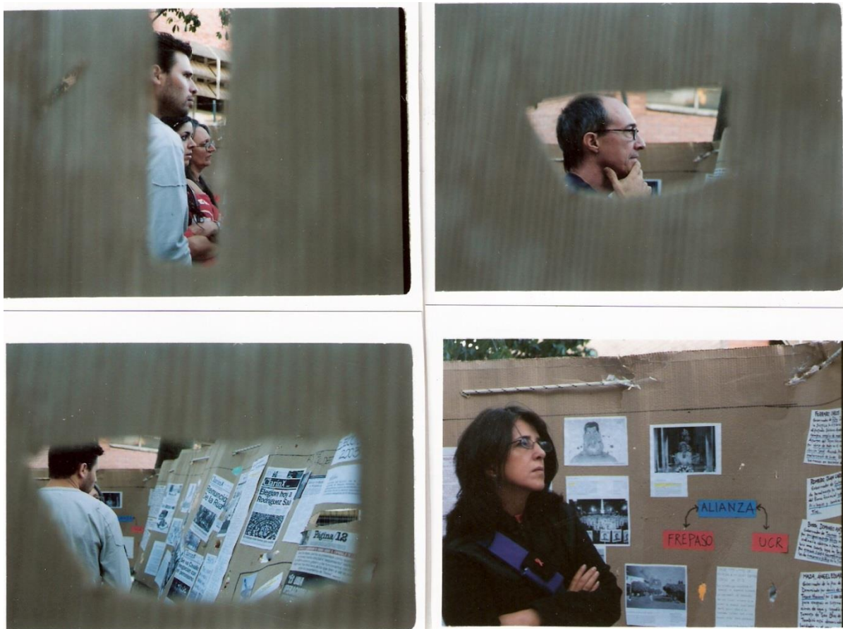
Ilustración 4. Triángulo de la memoria. 2006.

diversas dinámicas en la plaza de las calles México y Jujuy, y por el otro, se utilizaba una técnica de recreación para acompañar a la tradicional marcha encabezada por los organismos de derechos humanos desde el Congreso hasta la Plaza de Mayo.