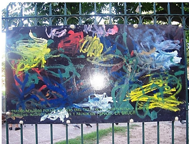
Ilustración 7. Obra colectiva del taller de expresión plástica emplazada en las rejas de la plaza de México y Jujuy. 2009.

El 26 de junio del 2002, bajo el gobierno de Eduardo Duhalde, las fuerzas policiales asesinaron a Maximiliano Kosteki y Darío Santillán, dos trabajadores desocupados que participaban de una masiva manifestación en la estación de ferrocarriles de Avellaneda, en las afueras de la Ciudad de Buenos Aires. Desde el 2004 La Oruga participó en los actos conmemoratorios de este hecho, conocido como "La Masacre de Avellaneda", coordinando