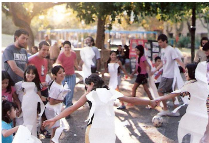
Ilustración 5. Siluetazo. 2005.

Con los niños se desarrollaba una adaptación lúdica de una actividad conocida como