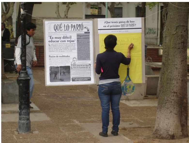
Ilustración 9. Una vecina sugiere contenidos para el periódico “Qué lo parió!”

Esta voluntad de politización (Gilman, 1997) instauró una inquietud por asegurar una recepción “correcta” del mensaje que circulaba en las actividades. Nos preguntábamos constantemente si la propuesta había sido “comprendida” por los vecinos. Por eso a la