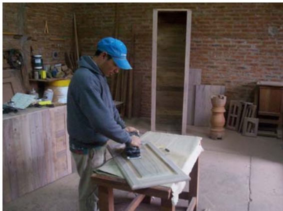
Pulidor de muebles: una actividad muy extendida en el centro del Chaco