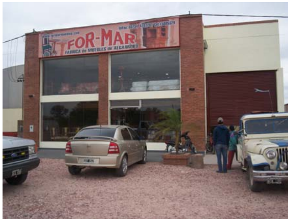
Aserradero, carpintería y salón de venta de muebles en Machagai, sobre ruta nacional 16.