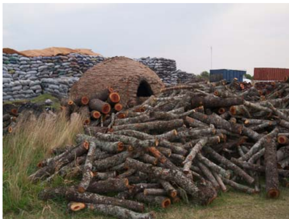
La producción de carbón aprovecha la leña y los sobrantes de madera de los aserraderos.