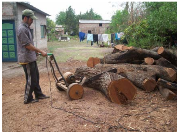
El pequeño fabricante de muebles y artesanías desarrolla su actividad con escasa tecnología.