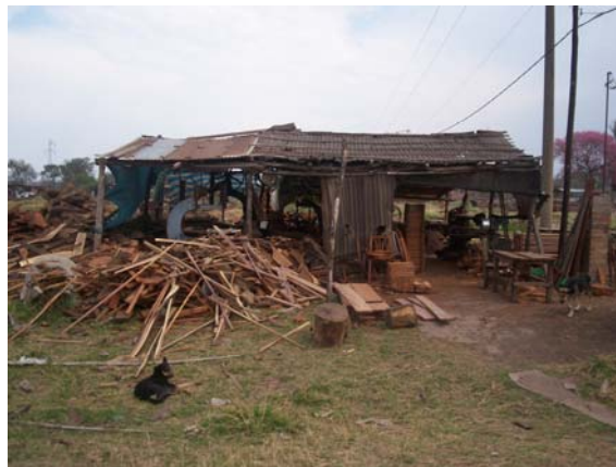
Pequeño aserradero en Presidencia de La Plaza.