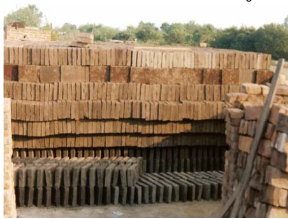
La producción de ladrillos: demanda leña y costaneros, que provienen de los aserraderos, para las horneadas