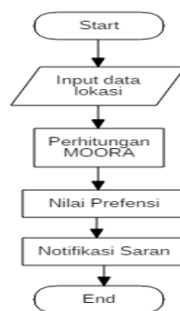
Gambar 2. Flowchart sistem

Desain Sistem membantu dalam menentukan perangkat keras ( hardware ) dan sistem persyaratan juga membantu dalam mendefinisikan arsitektur sistem secara keseluruhan. Desain sistem tersebut meliputi Usecase Diagram , ER Diagram , dan FlowChart