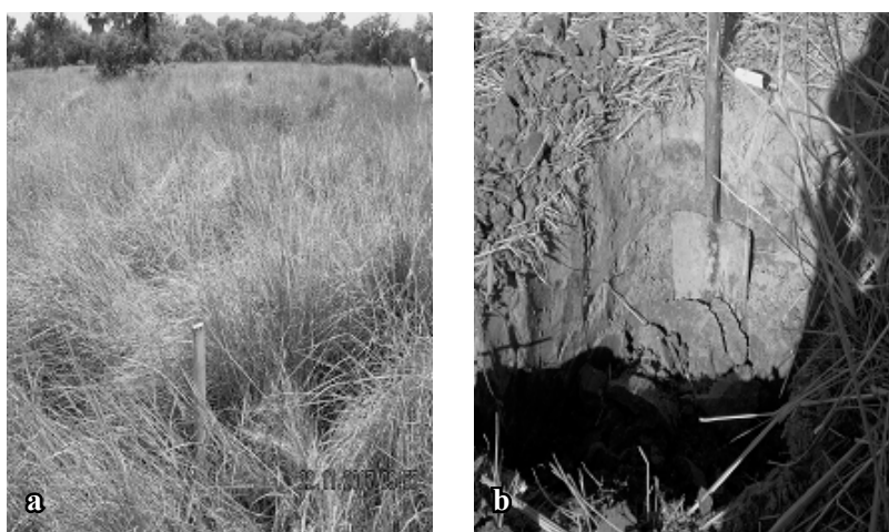
Figura 1: Lugar del sitio de muestreo. Foto a: pastizal de Sorghastrum setosum . Foto b: calicata de suelo bajo el pastizal de Sorghastrum setosum .