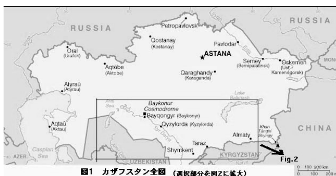
図1 カザフスタン全国（選択部分を図2に拡大）

カザフスタン（図1）はユーラシア大陸の中央部に位置する広大な内陸国で、北はロシア、南はキルギス、ウズベキスタン、トルクメニスタン、東は中国と接し、西はカスピ海に面している。天山支脈など南東部の山地を除き、国土の大部分は沙