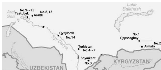
図2 調査値概図 (数字は表1の試料番号を示す)