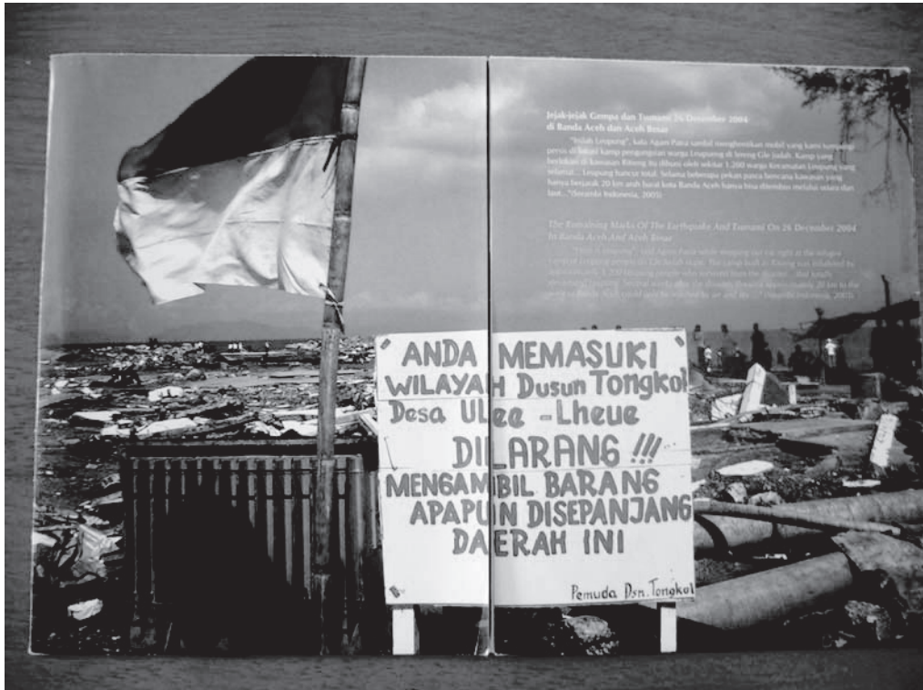
写真1：パンフレット見開き

州都圏で発行される新聞の一節を引用した上記の文章は、バンダ・アチェ市を囲むように位置するアチェ・ブサール県の中で最も被害が深刻であったルブン郡の様子を描いている。写真は、廃墟となったバンダ・アチェのウレレの様子を写し出しているが、写真には表れていない、寸断された道路とそれによる居住地の孤立について、この文章で述べられているのである。被災者が他の地域に設営されたキャンプや仮設住宅に移らねばならなかった程、津波による破壊が大規模に生じたということが示されている。