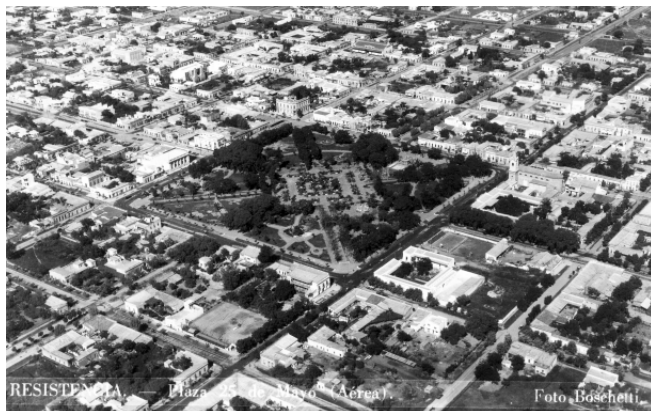
3. Pablo Boschetti. Vista aérea de la plaza 25 de Mayo de Resistencia y alrededores. 1935. Colección NEDIM

CUADERNO URBANO. Espacio, Cultura, Sociedad – VOL. 9 – Nº 9 (Octubre 2010) pp. 151-168. ISSN 1666-6186