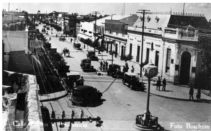
2. Pablo Boschetti. Vista urbana de calle Edison y Av. Alberdi. Ca 1934 Colección Mercedes Núñez de la Corte.

Las vistas urbanas revelan el dinamismo de la ciudad: los nuevos sistemas de transporte, la aparición del automóvil, las diferentes infraestructuras y mejoras urbanas que lentamente se extendían desde el centro de las ciudades hacia los barrios, como por ejemplo el tendido eléctrico, el alumbrado público y la pavimentación se conjugan con la emergencia de edificios públicos y privados que revisten los lenguajes arquitectónicos en boga. Asimismo, se registran las tareas de operarios que intervienen en la construcción de estas obras públicas, dando cuenta de la creciente actividad en las ciudades del Chaco. Todo ello se suma a las tradicionales vistas del período anterior, que siguen atrayendo la mirada fotográfica y posibilitan acceder a las transformaciones de esos espacios y edificaciones en diferentes períodos.