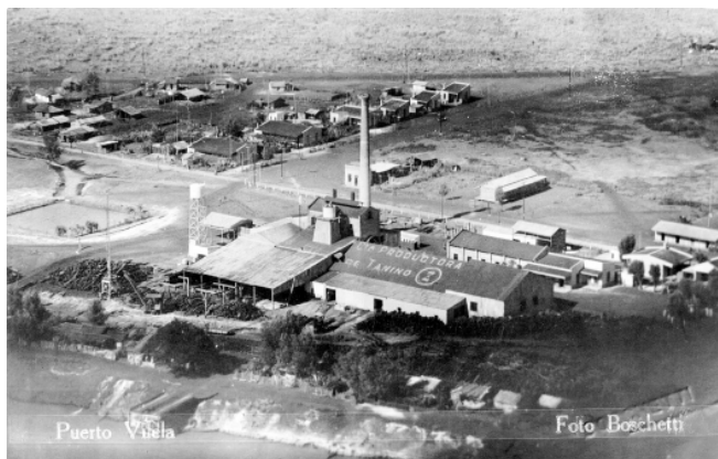
4. Pablo Boschetti. Vista aérea de la desmotadora de algodón «Z». Ca 1934. Colección CEDODAL

Por otra parte, en este período se afianzaba el desarrollo industrial en todo el territorio iniciado en la década anterior, por lo tanto las fotografías de los establecimientos industriales, mayoritariamente localizados en las ciudades, van a consolidar un imaginario visual sostenido por la idea de que el progreso radicaba visualmente en los procesos de urbanización y de industrialización. En el año 1935, como señalamos, se incorpora una nueva mirada fotográfica a través de las vistas áreas, que en el caso particular de los complejos industriales le otorgan especial significado al resultar una posibilidad para exponer en toda su magnitud la «grandeza» de estos emprendimientos. Sin embargo, en las fotografías publicadas en «El Chaco de 1940» se manifiesta otra intencionalidad de registro iconográfico que continúa en otras producciones: los interiores de los establecimientos, los obreros trabajando y las maquinarias asumen el rol protagónico atrayendo la perspectiva de una nueva mirada estética, en la que el foco está centrado en lo social. Las fotografías manifiestan una expresa voluntad de rescatar la labor obrera: ello se vincula con