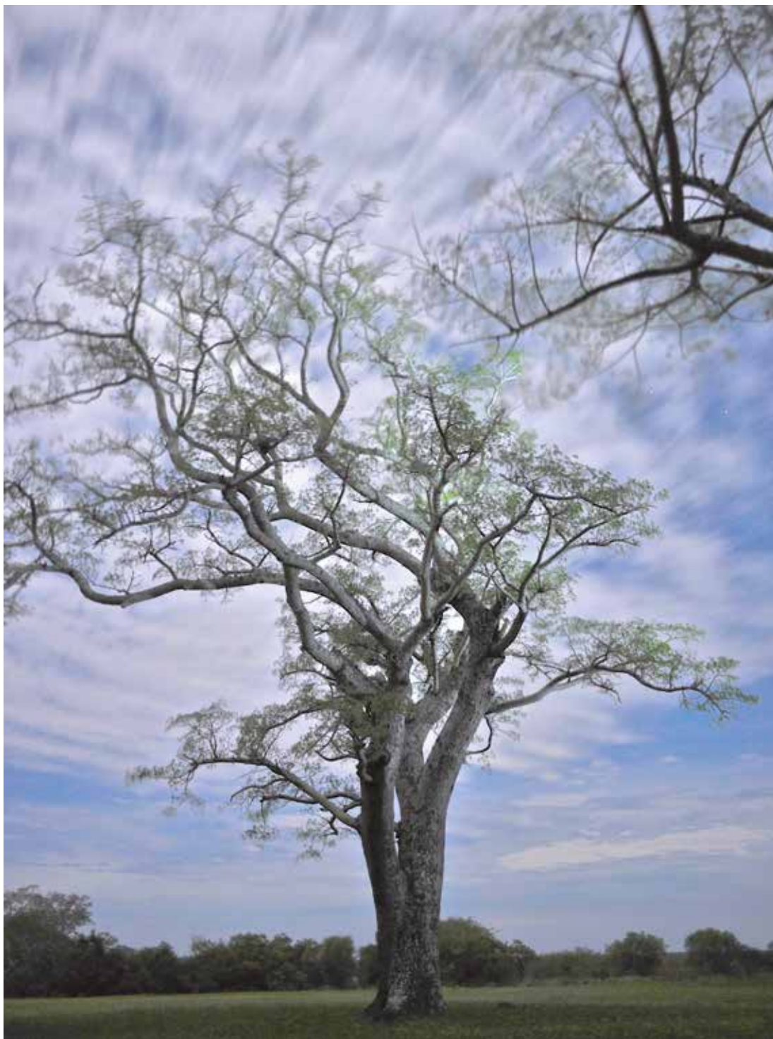
Luna Ilena-Estancia "El Transito" Concepción del Yaguararé Corá – Corrientes 2014. PH. Leopoldo Bayol