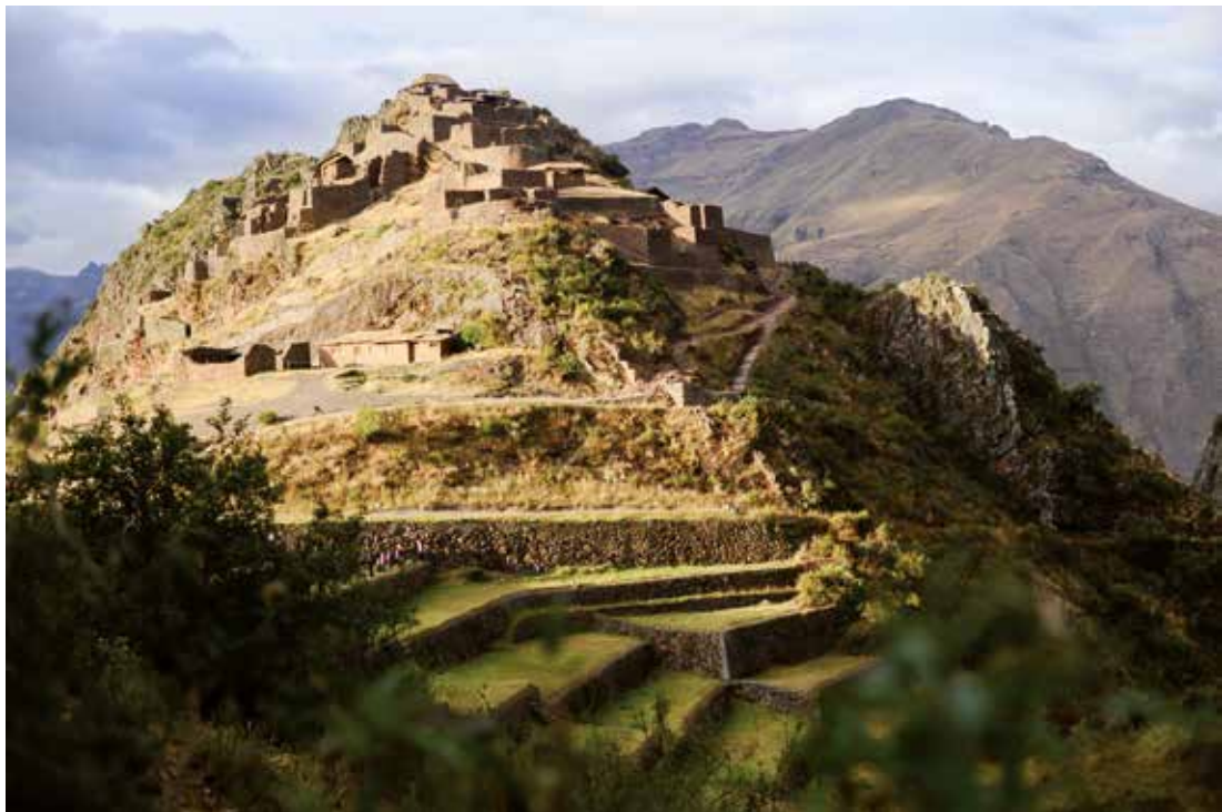
Primeros Rayos de luz . Pisaq, Templo del Sol. Peru 2016