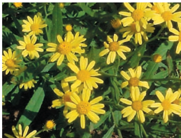
Figura 1: Flores de Senecio grisebachii .

Otros componentes del Senecio son terpenos e indoles, que forman parte de su aceite esencial. Se ha demostrado que sesquiterpenos combinados con ácidos