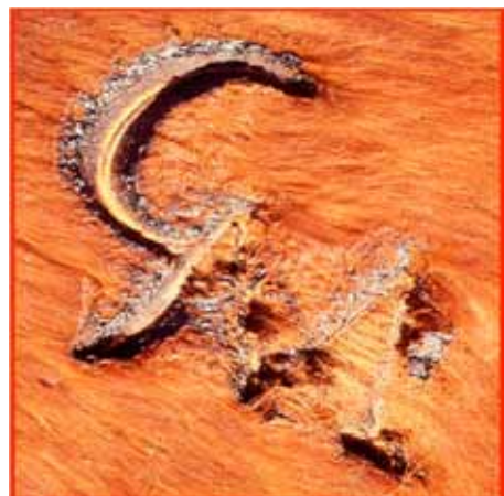
Figura 1. Marca a fuego con zona central de color amarillento y aspecto apergaminado; zona periférica con pelos chamuscados (día 1).

Día 48: se observó una retracción cicatrizal notable de la marca, cuyos bordes se hallaron cubiertos de escamas blancas.