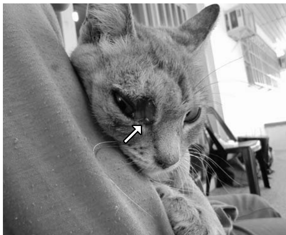
Figura 1. La flecha indica la lesión ulcerosa en la zona periocular del ángulo interno del ojo derecho del gato.

Para incrementar la sensibilidad y la especificidad de la reacción con el producto de la primera reacción se aplicó una segunda ronda de amplificación con iniciadores internos S17 y S18 11 que generan fragmentos de 490 pb. Se utilizó ADN de Leishmania chagasi (proveniente del Instituto Nacional de Parasitología "Dr. Mario Fatała Chaben") como control positivo y agua destilada como control negativo. Para ambas rondas se realizaron las reacciones propuestas en 1994 por Uli-