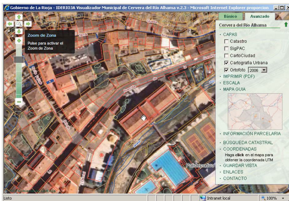
Figura 2. Visualizadores municipales