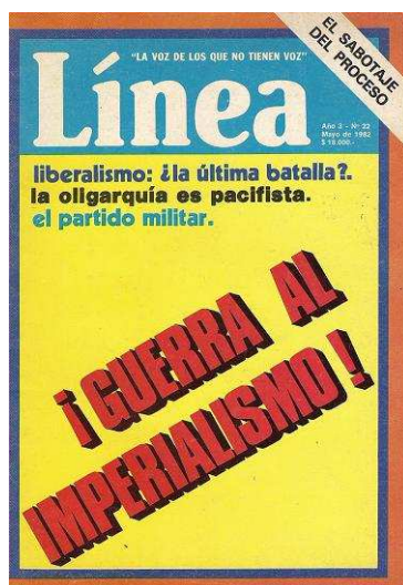
Portada de Línea N.º 22

La recuperación de Malvinas no se va a detener en la devolución de los archipiélagos, debe devolverse la Argentina, la Argentina íntegra, con sus ideales, sus industrias, su pueblo y su historia (23).