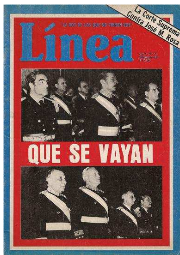
Portada de Línea N.º 11.

Este tipo de manifestaciones la hicieron permanente objeto de amenazas, procesos judiciales contra su director, el secuestro de ejemplares y problemas en la distribución en distintas provincias. No obstante estas complicaciones, Línea pudo continuar su publicación – salvo a fines de 1982, cuando luego de su clausura por orden judicial fue sustituida por la efímera revista Compañero – y sostener en sus portadas y contenidos interiores una retórica difícil de encontrar en otras publicaciones, más mesuradas y opositoras de la época, hasta el derrumbe de la dictadura luego de la derrota en el conflicto.