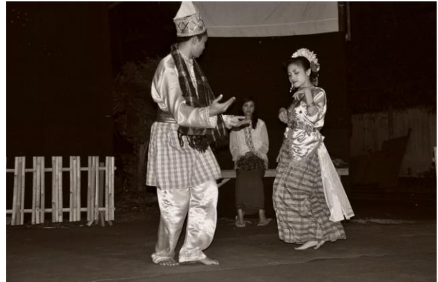
Gambar Tarian Sampela Ma Rimpu

Tarian Sampela Ma Rimpu diperankan oleh 2 (dua) orang remaja laki-laki dan perempuan. Pada jaman kerajaan, tarian dipentaskan untuk acara-acara kerajaan Dompu. Saat ini, tarian tersebut sering diadakan pada saat memperingati hari ulang tahun Kabupaten Dompu dan untuk menyambut tamu pejabat yang mengunjungi Kabupaten Dompu. Gambar tarian Sampela Ma Rimpu dapat dilihat pada Tabel 5.13.