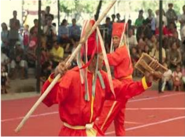
Gambar Tarian Buja Kadanda

diciptakan oleh rakyat. Berkat dukungan dari Kerajaan Bima dan para seniman istana, tarian ini kemudian mulai dikenal masyarakat luas. Buja kadanda sendiri merupakan tombak berumbai bulu ekor kuda yang digunakan penari sebagai atribut menarinya. Oleh karena itu tarian ini disebut dengan Tari Buja Kadanda atau Mpa'a Buja Kadanda . (Negeriku Indonesia, 2015).