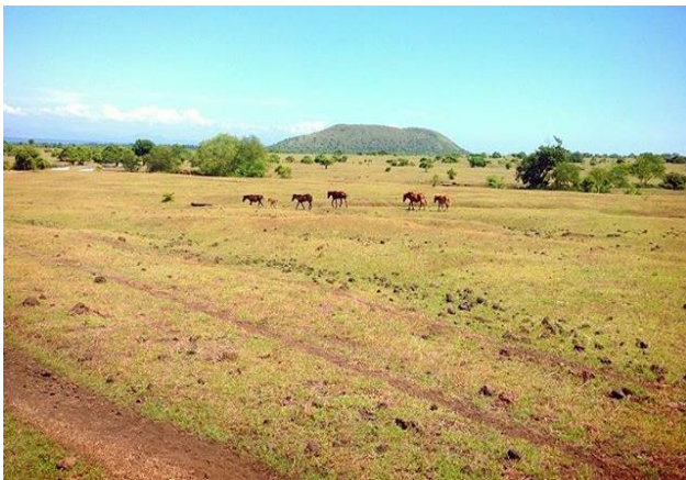
Gambar Padang Savana Doro Ncanga

Padang savana doro ncangan berlokasi di Desa Calabai Kecamatan Pekat Kabupaten Dompu. Padang savana ini merupakan satu satunya padang savana yang ada di Provinsi Nusa Tenggara Barat yang telah ditetapkan sebagai salah satu tujuan wisata di kabupaten Dompu. Padang savana doro ncanga berada persis di kaki gunung Tambora. Butuh waktu 30 menit untuk melintasi padang savana ini dari ujung timur sampai ujung barat dengan menggunakan kendaraan mobil, (Alfri, 2016). Aktifitas wisata yang bisa dilakukan yaitu mengelilingi padang savana dengan menggunakan kendaraan mobil serta para wisatawan dapat berkuda di lokasi tersebut. Selain itu, di lokasi padang savana ini setiap tahunnya diselenggarakan festival tambora.