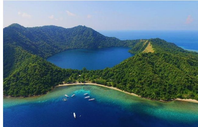
Gambar Pulau Satonda

air Danau Satonda asin dengan tingkat kebasahan jauh lebih tinggi daripada air laut biasa. Mereka bersama-sama menyimpulkan bahwa cekungan Satonda terbentuk dari kawah yang berusia lebih dari sepuluh ribu tahun, (kementerian lingkungan hidup dan kehutanan RI, 2015).