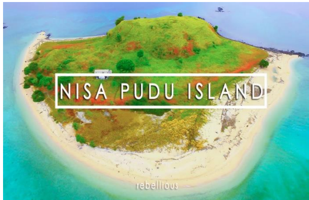
Gambar Pulau Nisa Pudu