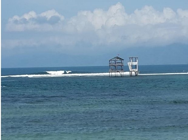
Gambar Lokasi Pantai Lakey

disebut ombak Periscope di Pantai Lakey-Hu'u. Pada tahun 1986 wisatawan mulai berdatangan dengan menggunakan kapal pesiar dari Denpasar ke Lakey-Hu'u, Ibrahim dalam Kurniansah (2016).