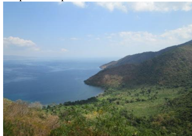
Gambar Nanga Tumpu

Selain untuk menikmati matahari terbenam, di daya Tarik wisata nanga tumpu pengunjung dapat menikmati suasana hutan lindung dekaligus pantai. Dengan akses yang mudah dan memiliki beragam atraksi yang bisa dinikmati tentu daya Tarik wisata ini sangat berpotensi untuk dapat dikembangkan menjadi daya Tarik wisata unggulan yang dimiliki oleh kabupaten dompu.