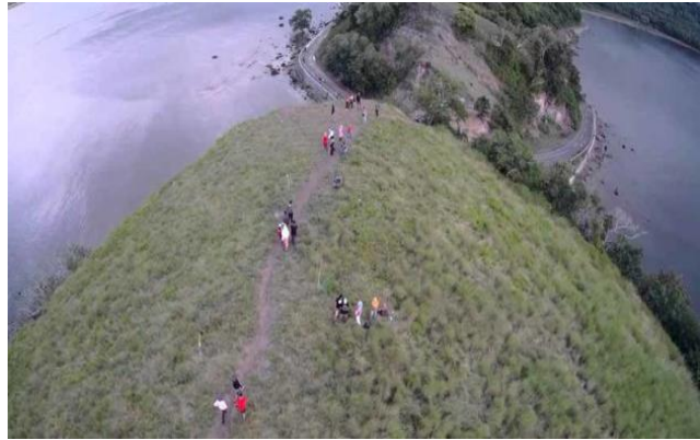
Gambar Bukit Matompo