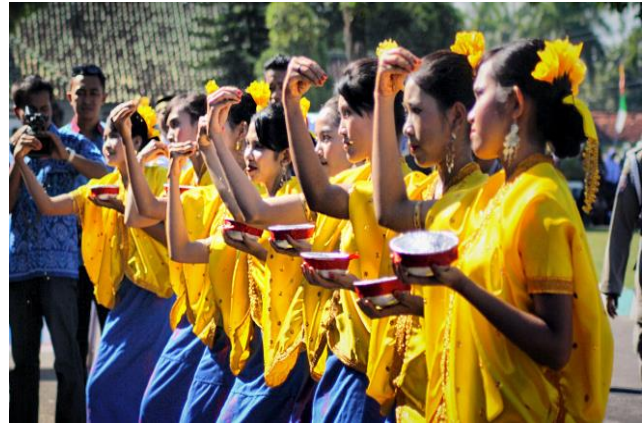
Gambar Tarian Wura Bongi Monca

Tarian Wura Bongi Monca biasa digelar pada acara-acara penyambutan tamu baik secara formal maupun informal, tarian ini dimainkan oleh 4 sampai 6 orang remaja putri dalam alunan gerakan yang lemah lembut disertai senyuman sambil menabur beras kuning kearah tamu (Mahmud, 2015). Gambar tarian Wura Bongi Monca dapat dilihat pada Gambar 5.9.