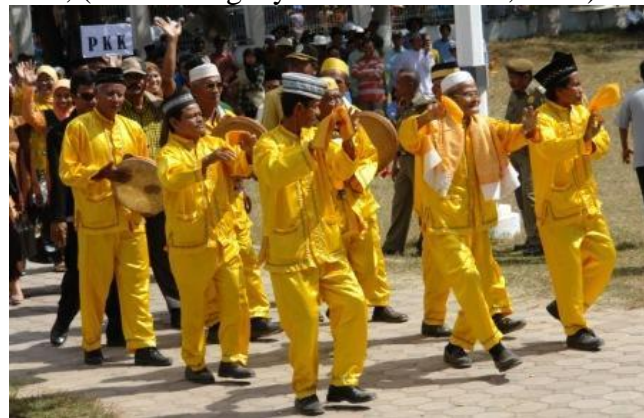
Gambar Tarian Hadrah

Tari hadrah sebenarnya tari tradisional Kabupaten Bima dan Dompu, tarian ini telah berkembang sejak abad ke-16. Tarian ini dipentaskan pada acara-acara penyambutan tamu, acara pernikahan maupun kegiatan ceremonial lainnya. Tarian ini dibawakan oleh para laki-laki dewasa yang berjumlah 6 sampai 12 orang dengan menyanyikan syair lagu dalam berbahasa arab, (bimakusurganyawisatanusantara, 2014).