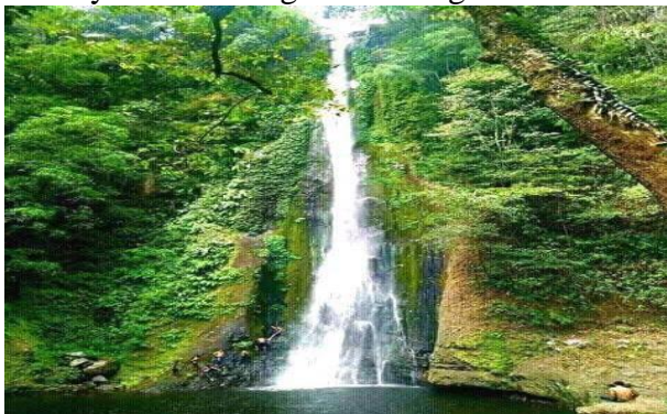
Gambar Air Terjun Panca Saneo

Akses transportasi menuju lokasi hanya dapat ditempuh dengan menggunakan sepeda motor karena akses jalan menuju lokasi masih rusak. Setelah sampai desa saneo, para pengunjung hanya membayar karcis parkir motor sebesar Rp. 10.000 (sepuluh ribu rupiah) dan dilanjutkan jalan kaki menuju lokasi Air Terjun Panca Saneo. Aktifitas yang dapat dilakukan oleh pengunjung di daya tarik wisata Air Terjun Panca Saneo yaitu berenang dan traking.