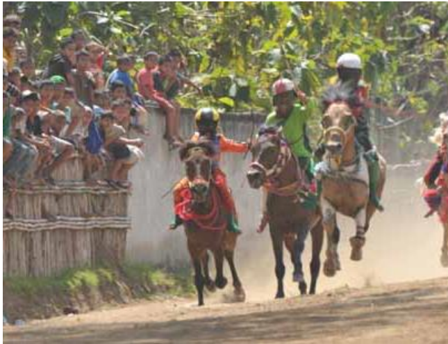
Gambar Perlombaan Pacuan Kuda