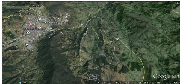
Figura 1. Localización de la zona de estudio

Hoy en día se presentan desastres ocasionados como consecuencia del cambio en el comportamiento del caudal en ríos o quebradas ocasionando desbordamientos e inundaciones. Por lo tanto, esta investigación presenta la aplicación del modelo matemático unidimensional Hec-Ras 4.1.0., software gratuito desarrollado por parte del Cuerpo de Ingenieros de la Armada (US Army Corps of Engineering) en la modelacion de las zonas de inundación de Q. Zipacha, ubicada en la zona suroccidental de Norte de Santander y situada en las coordenadas 7°22'34" latitud Norte y 72°38'54" longitud Oeste, además limita desde el Sur con la vereda Fontibón y en su mayor extensión en la vereda Chichira; por el Norte con las veredas Alcaparral y Naranjo, al Este con el municipio de la Labateca y al Oeste con las veredas Alcaparral, el Escorial y con el casco urbano del municipio de Pamplona (Figura 1).