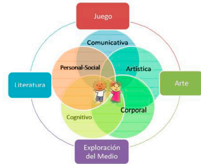
Figura 2. Diagrama de convergencia entre los pilares y dimensiones de la política pública de primera infancia colombiana