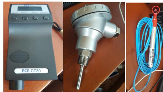
Imagen 7. Medios de medición