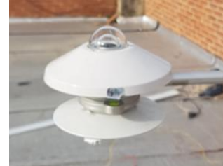
Imagen 1. Albedómetro