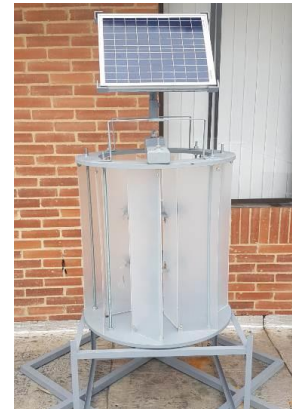
Imagen12. Sistema híbrido en desarrollo

A tenor con la necesidad de producir energía eléctrica a partir de la energía solar y eólica a bajos costos y teniendo en cuenta que en algunas localidades solo se dispone del potencial de unos de esos dos tipos de energía renovable, se ha pensado en el desarrollo en una instalación que disponga a la vez de paneles solar, o discos solares concentradores, y turbinas eólicas. En la actualidad se desarrolla una turbina eólica vertical con panel solar incorporado, que la convierte en un sistema híbrido, como se muestra en la Imagen 12, prototipo de máquina en proceso de estudio y perfeccionamiento.