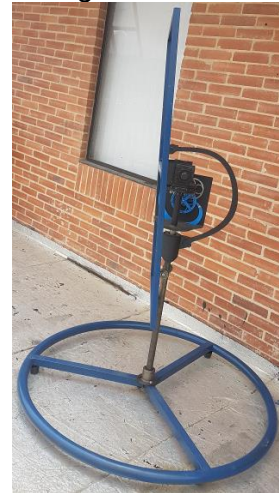
Imagen 9. Seguidor solar desarrollado

desarrollo de micro tecnología, fueron evaluados sus altos costos de fabricación; por lo que han sido desarrollados varios posibles modelos de seguidores de bajo costo con consumo eléctrico mínimo y que dispongan de movimiento en los planos azimutales y cenitales, como se muestra en la Imagen 9. Uno de los modelos fue sometido a la Convocatoria 793 de Financiamiento de Invenciones y Patentes, lográndose financiamiento para el estudio de su posible patentabilidad.