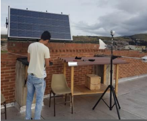
Imagen 4. Montaje de panel solar por estudiantes

universidad para su estudio, ver Imagen 4.