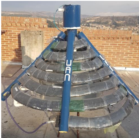
Imagen 8. Calefactor solar desarrollado

A partir de la comparación del calefactor solar con un calefactor eléctrico también adquirido se procedió a diseñar un calefactor que reuniera las mejores condiciones de ambos equipos estudiados. Se generó su diseño, a partir del mismo hasta la actualidad se han construido dos prototipos, en la actualidad se trabaja en un tercero. El prototipo de calentador solar presentado en la Imagen 8 está actualmente en proceso de ser patentado, en el mes de julio de 2017 fue radicada la solicitud de patente en la Superintendencia de Industria y Comercio de la República de Colombia.