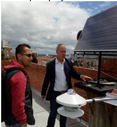
Imagen 13. Presentación de temas para proyectos de curso.