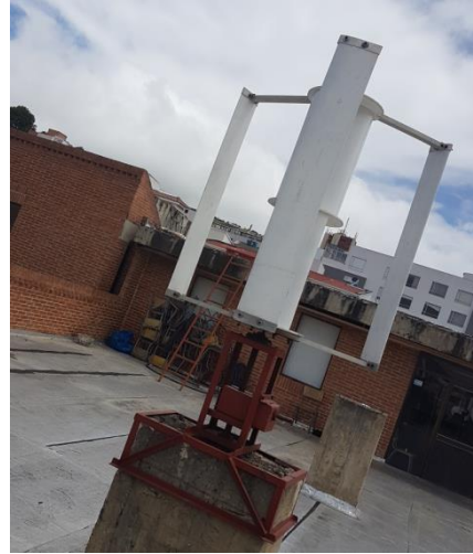
Imagen11. Turbina vertical híbrida