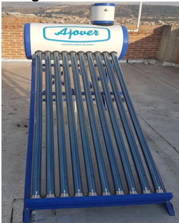
Imagen 5. Calefactor solar