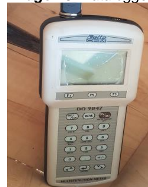
Imagen 3. Datalogger