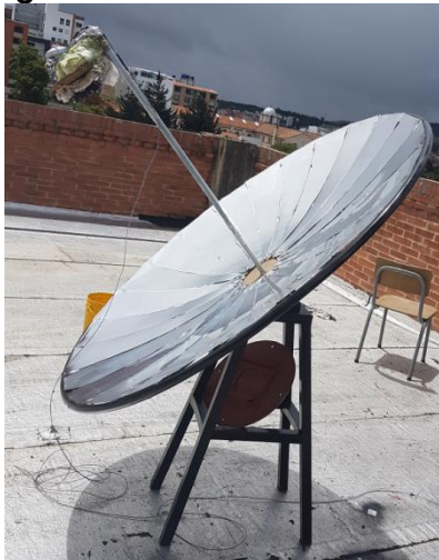
Imagen 10. Disco solar desarrollado

El uso de las turbinas eólicas es promisorio para la producción de energía eléctrica de forma masiva interconectada a la red. Sin embargo, para la producción de energía eléctrica a partir de la energía eólica en zonas pobres no interconectadas se necesitan máquinas duraderas, eficientes y de bajo costo. Por tanto, se procedió a estudiar diferentes tipos de modelos de turbinas existentes en el mercado. Se arribó a la conclusión de que las turbinas verticales son muchos más fáciles de diseñar y construir, aunque es conocida su menor eficiencia respecto a las horizontales. Con tales elementos en consideración se han podido diseñar y construir varios modelos de turbinas verticales, en particular los modelos Savonius y turbinas híbridas a partir de los modelos Savonius y Darreious, como se muestra en la Imagen 11. Los modelos, construidos a escala, están en proceso de pruebas y ensayos.