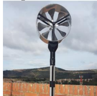
Imagen 2. Anemómetro