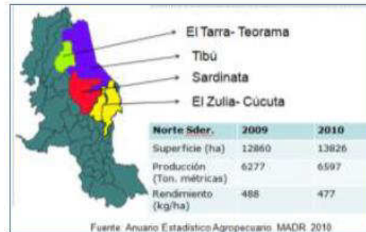
Figura 1. Zonas visitadas del departamento Norte de Santander y datos de producción departamental.

enmiendas, control de malezas, control de plagas/enfermedades, podas, beneficio, secado, limpieza y empaquetado del grano necesarios para la producción de cacao.