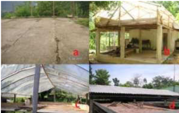
Figura 3. Instalaciones encontradas

El secado del grano en las fincas evaluadas se realiza mediante estructuras como marquesinas solares, casas elba, elba-gaveteros y patios de secado (Ver Figura 3), por lo que el uso de combustibles fósiles para realizar un secado forzado del grano no se tuvo en cuenta en este estudio.