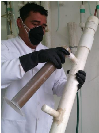
Imagen 3. Inoculación de los DI-FAFS

Fuente (Rodríguez, J. y Maldonado J.I., 2015)