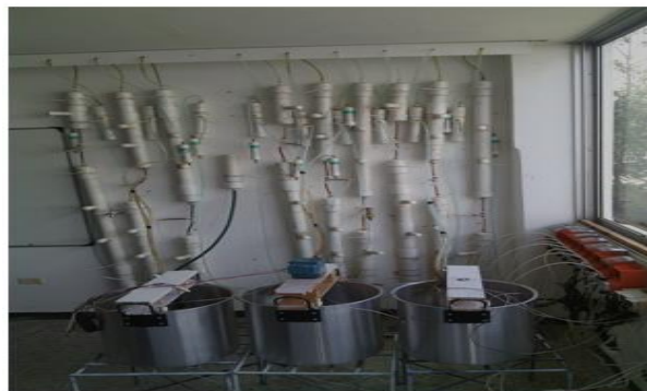
Imagen 1: Montaje general las tres series de DI-FAFS