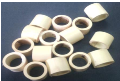
Imagen 2. Medio de soporte de los DI-FAFS