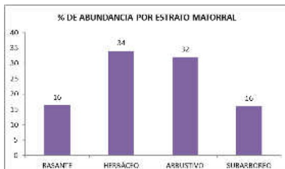
Figura 3. La abundancia en cada estrato del matorral.

El estrato Subarbóreo presenta el 16 % el estrato arbustivo el 32 % el estrato herbáceo 34 % y el estrato rasante el 16% en la segunda seré sucesional del área estratégica de la parte alta de la cuenca del Rio Pamplonita. (Ver figura 3).